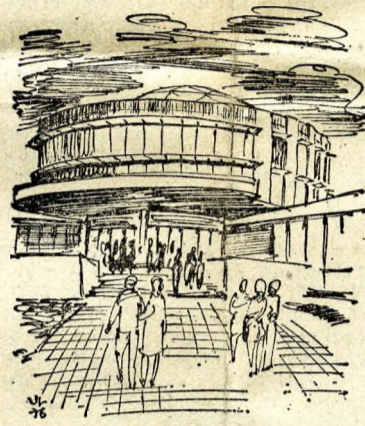
A Pataky István Művelődési Központ

A JÓK — ÉRVENYESÜLHES-SENEK. Lássunk most egy konfliktust a sok közül. A vendéglátók — alaposan készülve az elnök kőbányai kalauzolására — érzékeltettek néhány számtani-gazdaságossági leckét, ha úgy tetszik, meghökkenítő ellentmondást. Mindenekelőtt a legjobb gyárak pillanatnyi zsákutcáját. Kiragadtak közülük hármat, amelyek együttesen évi 11 milliárd forint értékű terméket állítanak