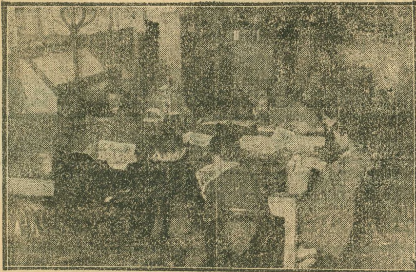
Külsővárosiak szorgalmasan olvasgatnak a vágútcái kölcsönkönyvtár olvasótermében.

A nők főleg a régi magyar irodalmat kedvelik és szívesen olvas-