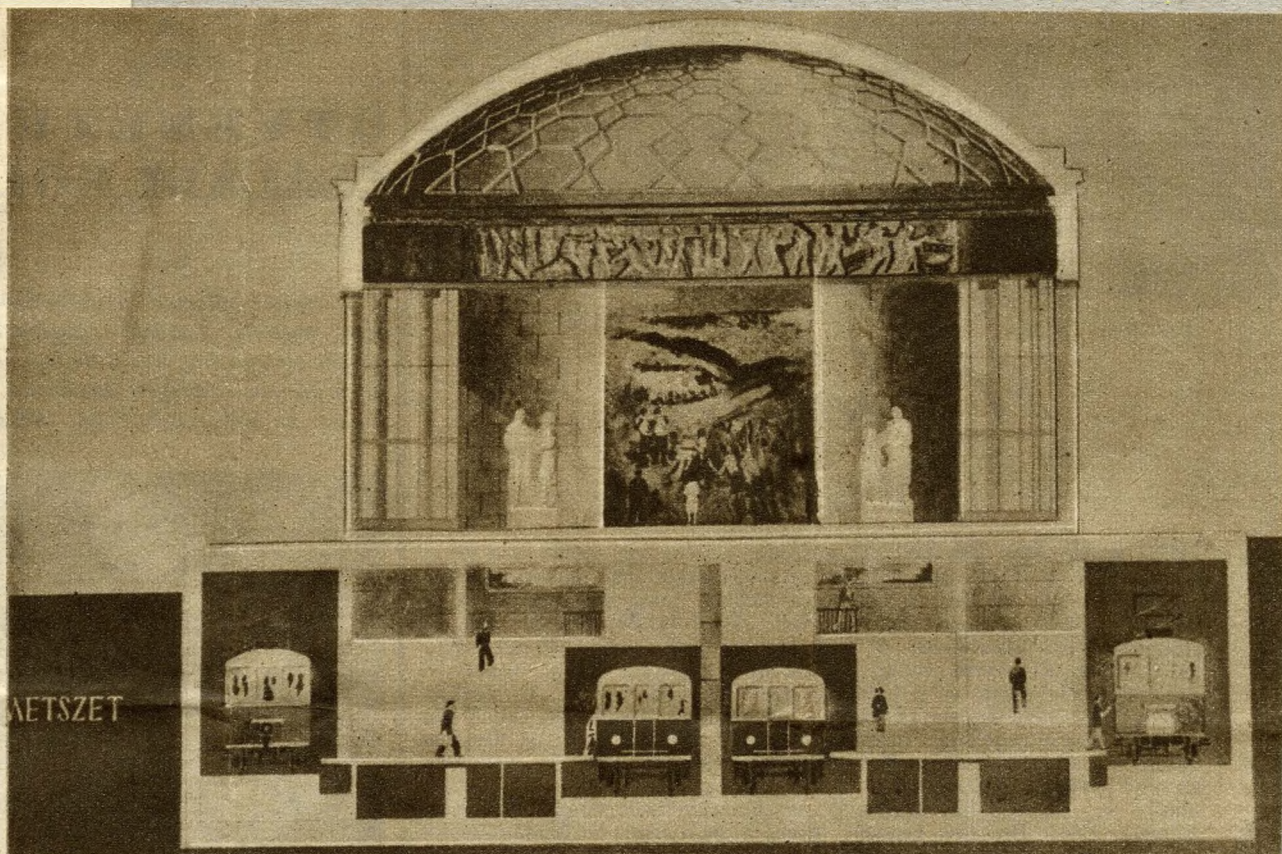
A Budapesti Földalatti Gyorsvasút egyik végállomása a Népstadionnál épül. Ez a felvétel a végállomás tervének keresztmetszete: az állomás négy emeletnyi magasságban és mélységben készül