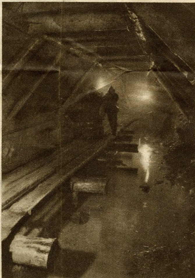
A talajvizet betörése ellen folyó kemény küzdelmek közt épül a Földalatti Gyorsvasút egyik szellőző alagútja — a Vérmező alatt