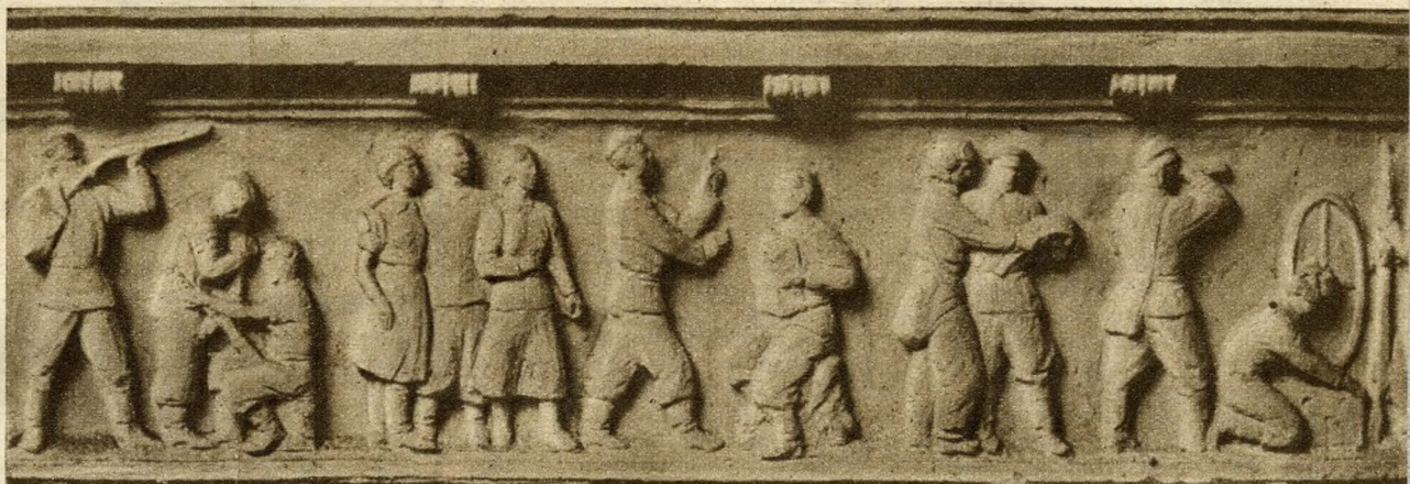
Ilyen művészi kivitelű domborművek díszítik majd a pályaudvar csarnokának falait