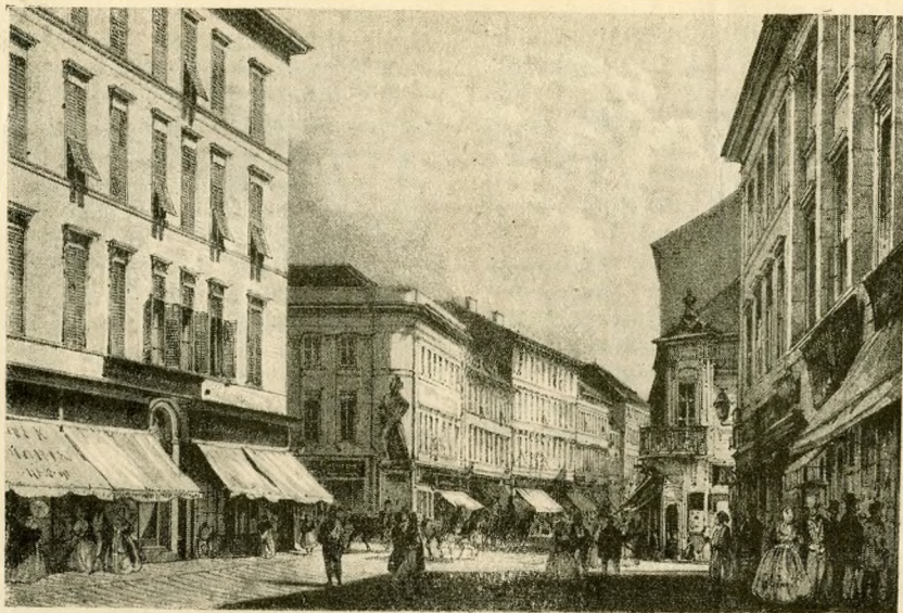
A régi Buda és Pest emlékkiállításból. Alt Rudolf: A régi Váci-utca. 1845.