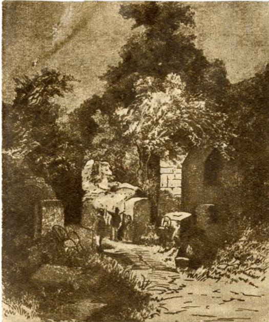
A sziget romja. (Metszet 1871-ből.)

tor maradványait kiásták régészeink, gazdag anyagot tárva fel a magyar középkorról. Egyhajós, hosszú szentélyű, szép nyolcszögű toronnyal ellátott templom állt itt, délre tőle négyszögű, emeletes kolostor emelkedett, körüljárós udvarral, kútházzal, konyhával. Ezt a román stílusú épületet a XV. században