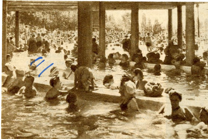
A Palatinus fürdő meleg medencéje

benne. De a 110 darab márványt régőszeink összerakták, s a díszes koporsó ma múzeumban látható. A kutató ásó gyakran vet föl itt kincseket. 1897-ben egy kertészfiú arannyal bevont ezüst királyi koronát talált a romok közt.