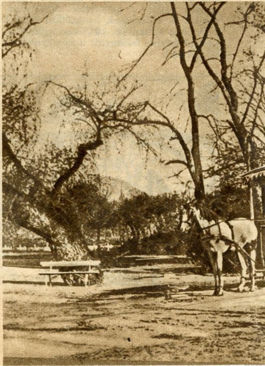
Az egykori lóvasút

Amikor a törökök elfoglalták fővárosunkat, katonai okokból lebontották a sziget épületeit. De a dominikánus kolos-