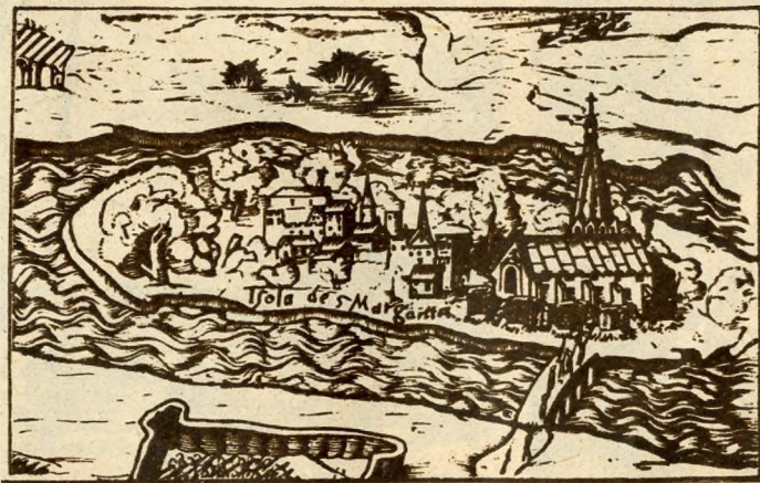
A kolostorok és a templom. (Egykorú metszet 1542-ből)

Margitot, ide hozatta, ide szemmel kísérje fejlődését. Két történetírónk, Mályusz Elemér és Mezey László , magyarázzák, hogy Árpád-házi Margit is ilyen begina volt fővárosunk első női monostorában. Boldognak és szentnek mondta a magyar nép, századokkal a pápai döntés előtt.