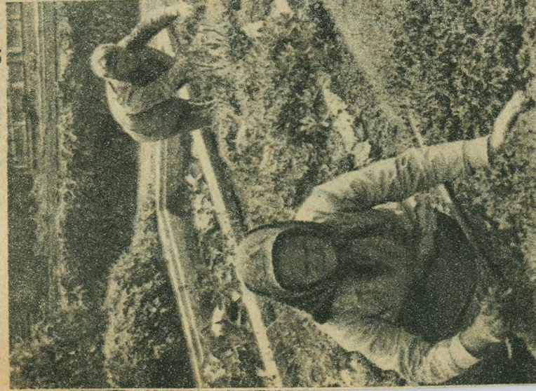
Itt ápolják a sziklakertek endekes, ritka növényeit. A hatalmas virágyágakban szakadtanul folyik a munka, hogy minél hamarabb megvalósuljon a »virágos Budapest« gondolata.

Igy készül a »FÖKERT«, a közösgesített Fővárosi Kertészet a »virágos Budapest« megvalósítására.