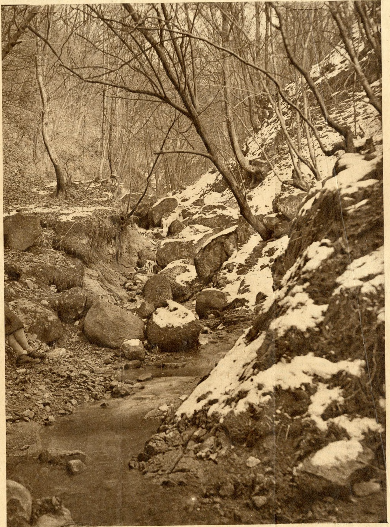
Márciusi hó a Holdvilág-árok sziklás patak medrében.