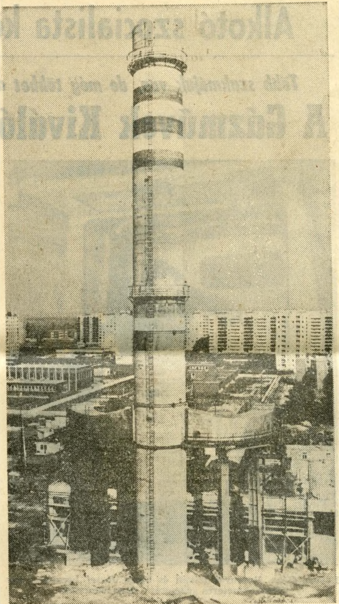
Ellesett pillanat a nagy építkezésből. Ma már 14 181 lakást fűt az újpalotai fűtőmű

Az előkészítési hibák mellett a nagy volumen, mely a tervidőszak alatt oly meredeken nőtt, elkerülhetlenné tet-