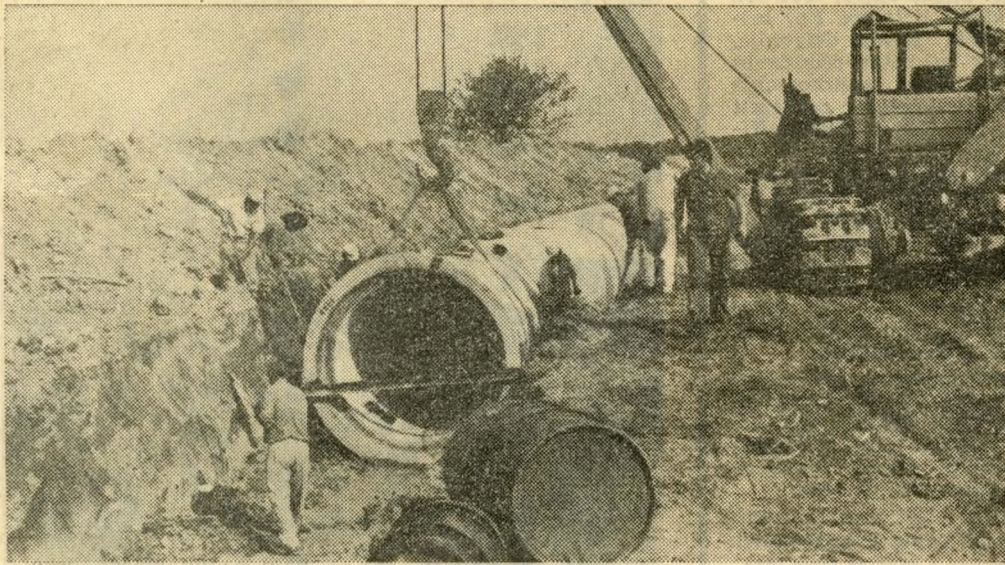
Tíz kilométer hosszúságban fektették le a Vízművek csepeli üzemében készült 1800 milliméteres átmérőjű Rocla-csőveket a földbe Szigetújfalu határában

tása hatalmas feladatot jelentett, mert csupán alapközművesítésük költsége megközelíti a másfél milliárd forintot.