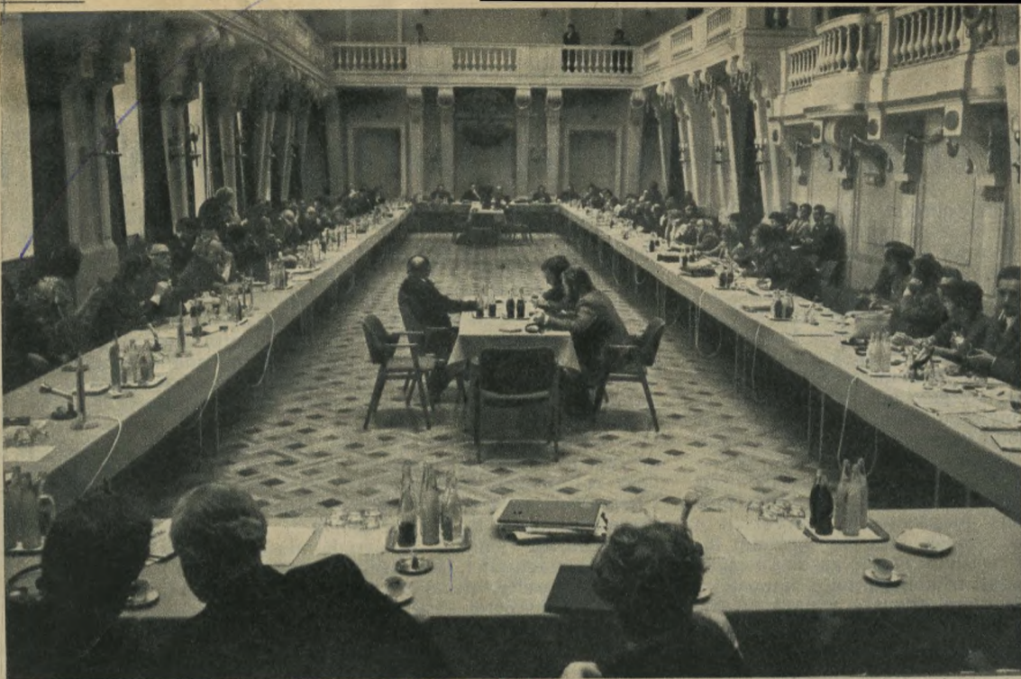
Tanácskoznak az európai fővárosok polgármesterei