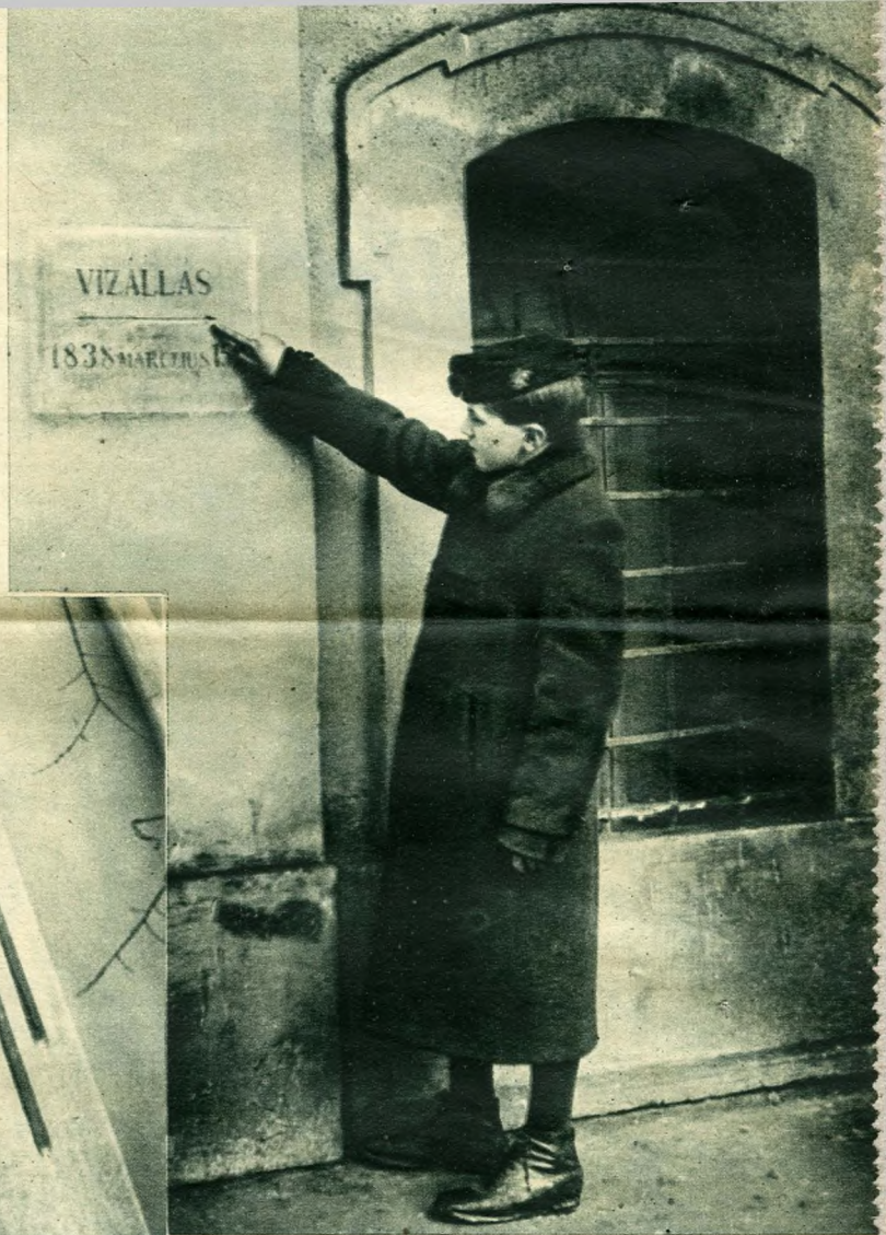
ilyen magas volt az árvíz a mai Rókus kápolna helyén