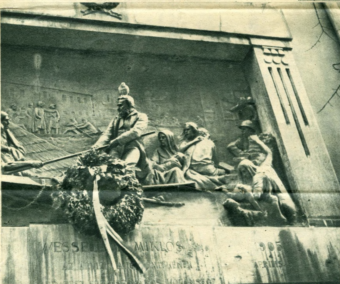
Az árvízi hajós emléktáblája a ferencrendiek templomának falán