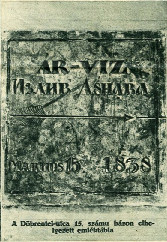
A Döbrentei-utca 15. számú házon elhelyezett emléktábla