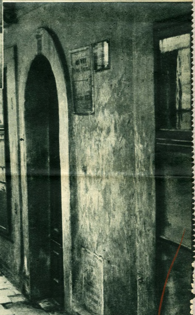
A Rác-városban egészen a kapuboltozatig ért az árvíz, (Döbrentei-utca 16.) A kapu alján az 1775-ös emléktábla.