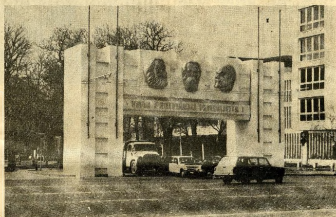
Díszkapu (Gorkij fasor)