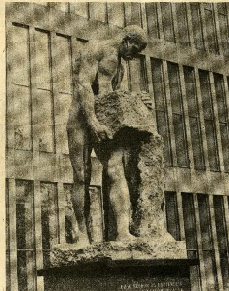
A kórákó ember szobra (MÉMOSZ-székház)