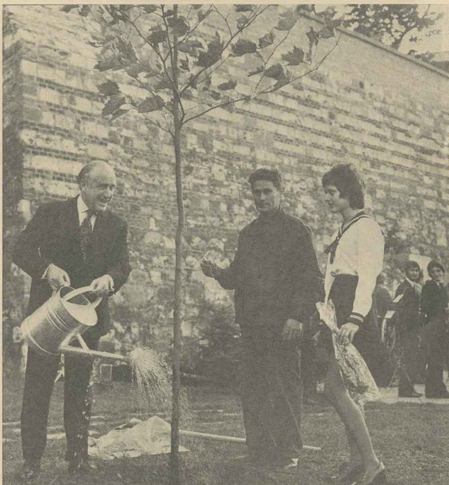
Die Geburt des Europa-Parks