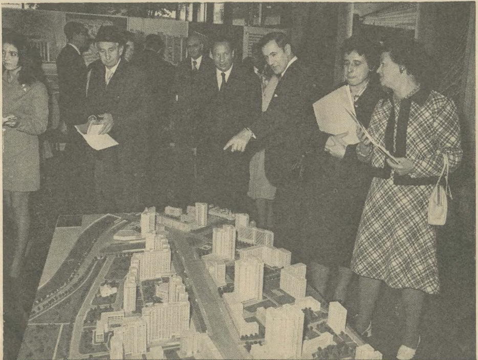
„Ein Blick auf die europäischen Hauptstädte“, hier auf den Moskauer Newski-Projekt

reihen, zu einem Rechteck zusammengestellt, schmückten die Fähnchen der teilnehmenden Länder. Nach dem ungarischen Alphabet „geordnet“ sassen dort die Delegationen der Hauptstädte; neben Berlin z. B. hatte Wien (Bécs), daneben Belgrad Platz genommen. Die Stirnfronten des schönen Saales wurden durch eine grosse Nachbildung der goldbraunen stilisierten Gedenkmedaille geziert, die übrigens auch alle Einladungskarten zu diesem grossen Treffen schmückte. Vor dem Tisch, an dem der Budapester Oberbürgermeister Platz genommen hatte, häuften sich im Verlaufe der Tagung die Gastgeschenke der europäischen Hauptstädte an die ungarische Metropole: Bildbände, vergoldete Schlüssel alter Stadttore, Keramiken, Wappen, Vasen... Die Städte schienen um das originellste Gastgeschenk, um das typischste Zeichen ihrer selbst regelrecht zu wetteifern! Die Referate der einzelnen Stadt-oberhäupter, deren Themen übrigens nicht „vorgeschrieben“ waren, sondern