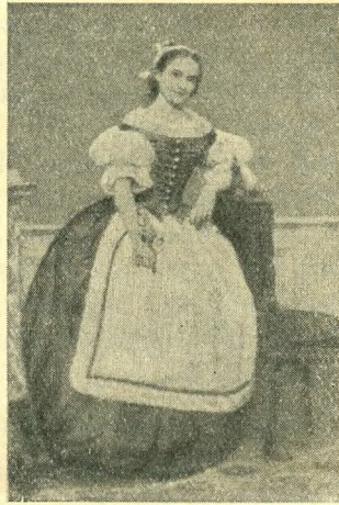
Lerdvayné A szízesztendős Nemzeti Színház