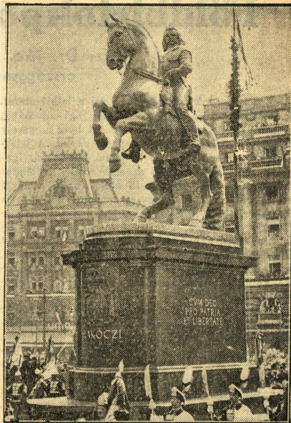
II. Rákóczi Ferenc szobra

A Rákóczi-szobor esetében egészen más, sokkal hatalmasabb és nehezebb volt a feladat: egy igazán monumentális lovasszobor kiképzése és elhelyezése óriási téren, kevert építészeti jellegű, félig görögös, félig modern hangsúlyú, nagyvárosi környezetben. Fejedelmi emlékmű, reprezentatív hősbábrázolás, még hozzá barokkstílusban, miután Rákóczi kora a barokkban fejezte ki magát. (Hol vagyunk mi a reneszánsz művészetétől, amely a legtávolabbi multat is saját ruhába öltöztette, korszerűvé lényegítette és mindent a maga formanyelvére írt át!) Pásztor Rákóczi-tárhát barokk-szobor, ágaskodó, nehéz barokk-lóval és páncélos barokk-figurával. Még szokni kell hozzá, hogy végleg el merjük dönteni: valóban