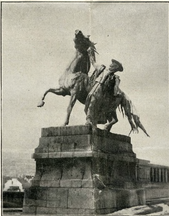
Pomnik „Csikosa” w Budapeszcie

Wśród pozostałych efektów mniej lub więcej przekonywujących, uderzył mnie szczególnie jeden motyw. Przywykliśmy od dziecka uważać Węgry za ojczyznę soli. Ze