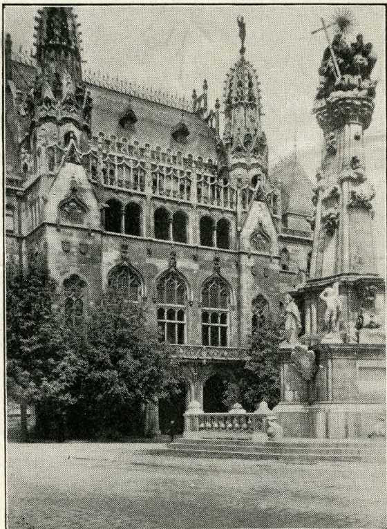
Budapeszt. Kolumna św. Trójcy przed gmachem ministerstwa skarbu

Szczęśliwi ci Węgrzy! Dziesięć minut tramwajem od centrum, tramwaj staje pośrodku mostu, skąd kilka kroków grobla i jesteś na budapeszteńskiej Saskiej Kępie, na wyspie Małgorzaty, która się powinna nazywać wyspą szczęśliwości. Niedosć, że opływa ją błękitny Dunaj, jeszcze tryskają na niej źródła mineralne o pierwszorzędnej wartości leczniczej. Latem zamiast w dusznej łaźnicy, można odbywać kurację pod otwartym niebem. Na trzech kondygnacjach ogrzającego basenu, do którego pluja wrzątkiem