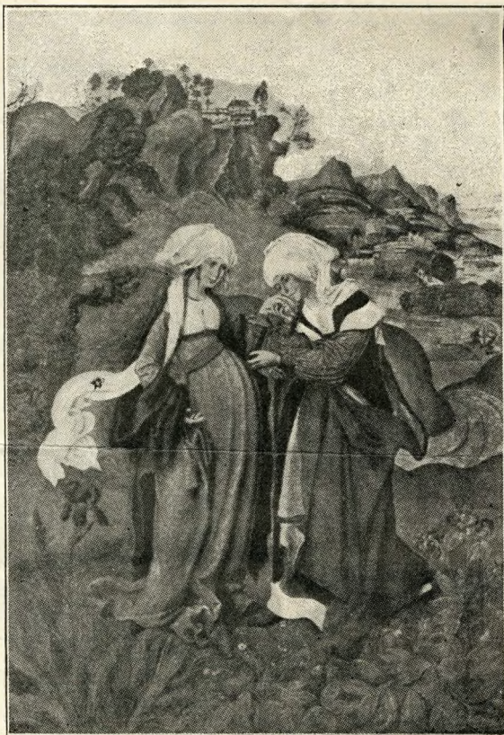
Nawiedzenie Mistrz M. S. (Muzeum Narodowe w Budapeszcie)

podziemnym lwie paszczę, możesz jak w trzech kręgach piekieł zakosztować rozmaitej temperatury. A obok czystułka plaża i błękitna, aż do betonowego dna, pływalnia,—wielka akwamarina na piersi wyspy, wezbranej mlekiem ożywczych źródeł, jak pierś matki.