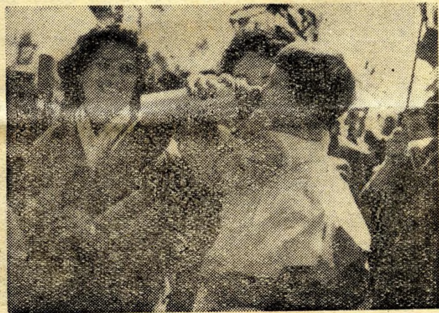
Jólesik egy kis frissítő a menetben.