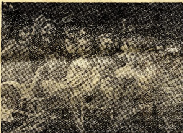
Munkások és parasztok együtt ünnepeltek május elsején.