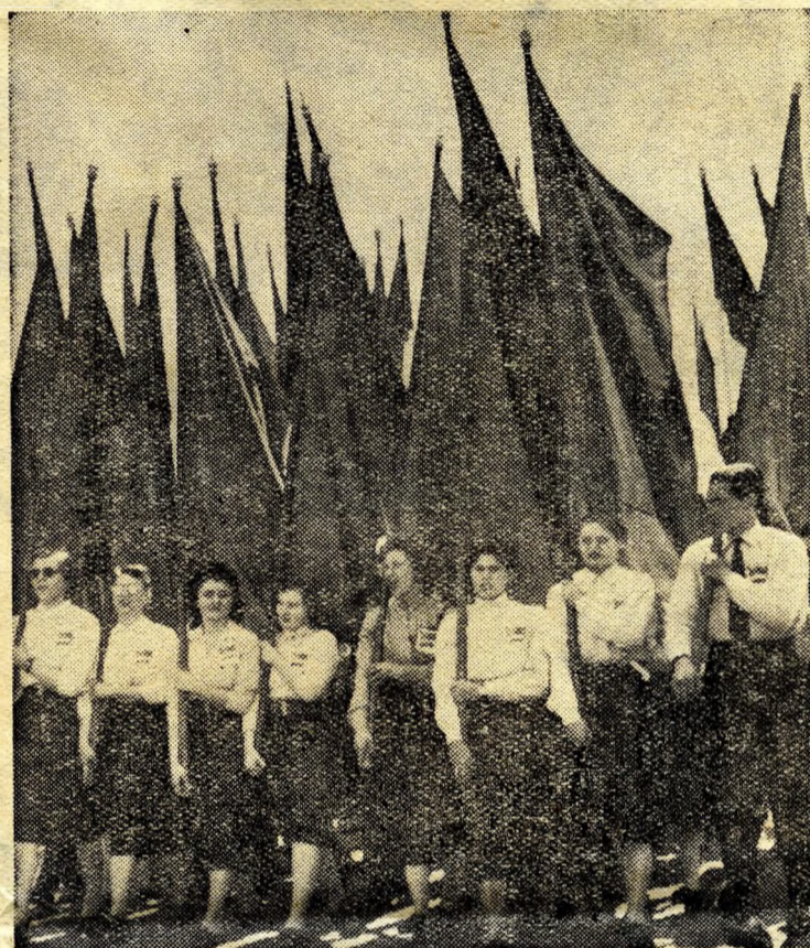
KISZ-fiatalok a felvonuláson.