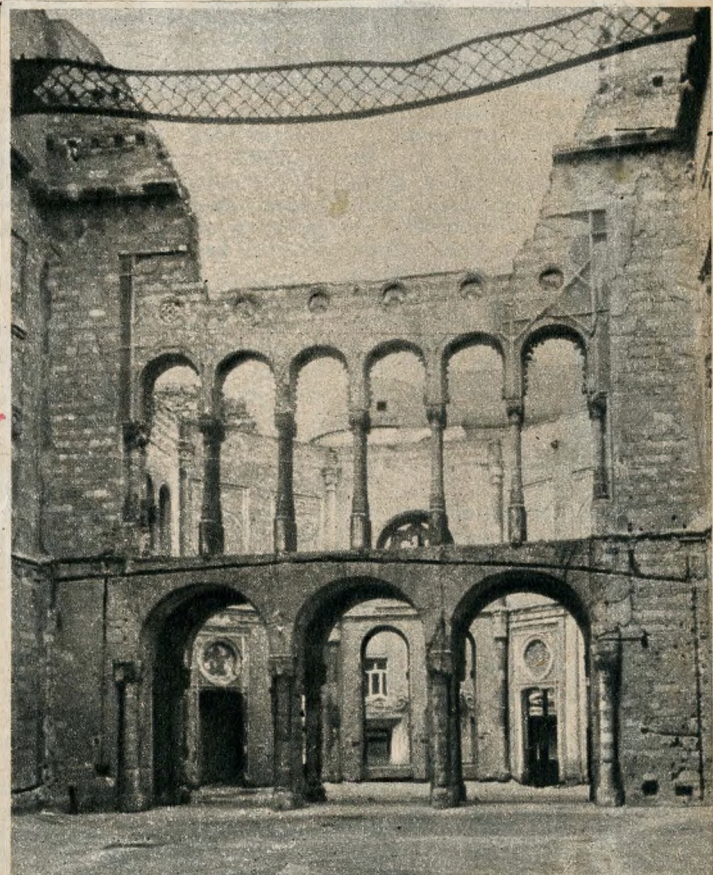
A nagyterem — romokban