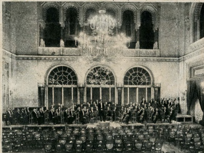
A Vigadó nagyterme a háború előtt