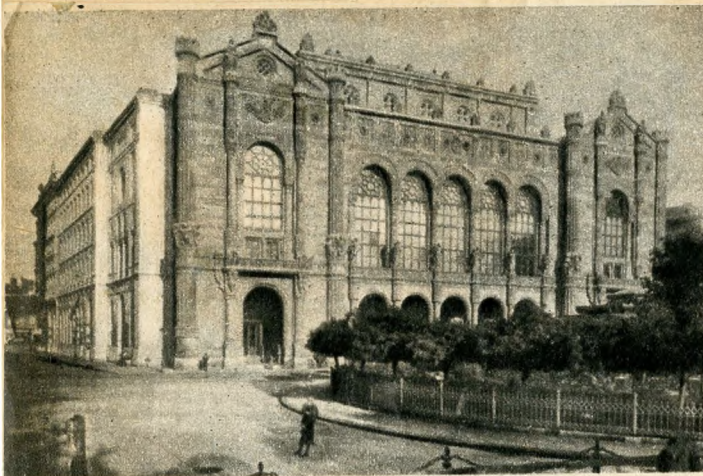
Az egykori Fővárosi Vigadó homlokzati része a Dunapart felől