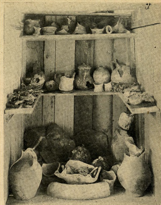
A Halászbástya földalatti titkai. Olajlámpák, kulaesok, lábasok, amelyeket az egykori Jezuista-kolostorban találtak és a Halászbástya legközelebb megnyitandó muzeumában helyeztek el

Rendkívüli érdekességeket tár elénk ez az ismeretlen múzeum, amelynek tárgyai misztikus helyekről: földalatti folyosók rejtekéből, kolostorok sziklába vájt pincéinek fenekéről kerültek elő. Ez a földalatti folyosó a várhegyet szántja keresztül s a Nándor-téri laktanyától kiindulva az egykori Domokos-kápolna, a koronázó templom, a hajdani jezsuita kolostor, a Ha-