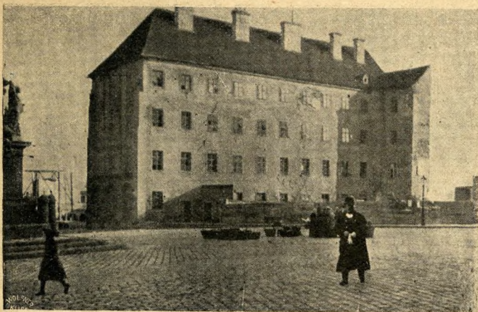
A régi Jezsuita-kolostor, amelyet 1896-ban bontottak le

lászbástya pincével kapcsolatos, elhuzódik messzire. A Domokos-kápolna IV. Béla király korában épült, s mikor szomszédságában a Halászbástyát megalkották, olyan veszedelmesen kezdett dűledezni, hogy le kellett rombolni. A régi pénzügyminisztérium épületébe élvele maradt még falának egy omladéka emlékképpen.