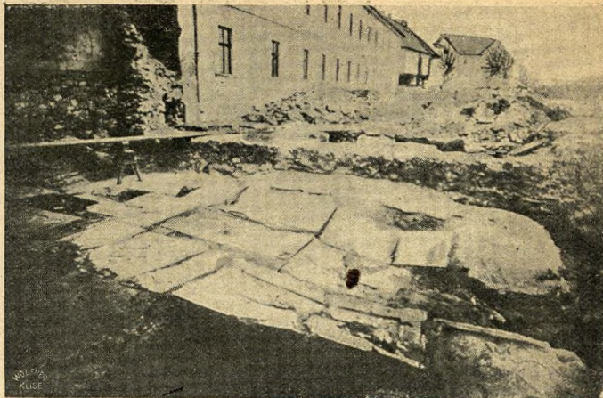
Sírkövek, melyekkel a törökök szobáikat kikövezték

Ujabb magyarázatot nyújtanak a Mátyás korából való kínzó szerszámok, amelyekből egész sorozat lát-