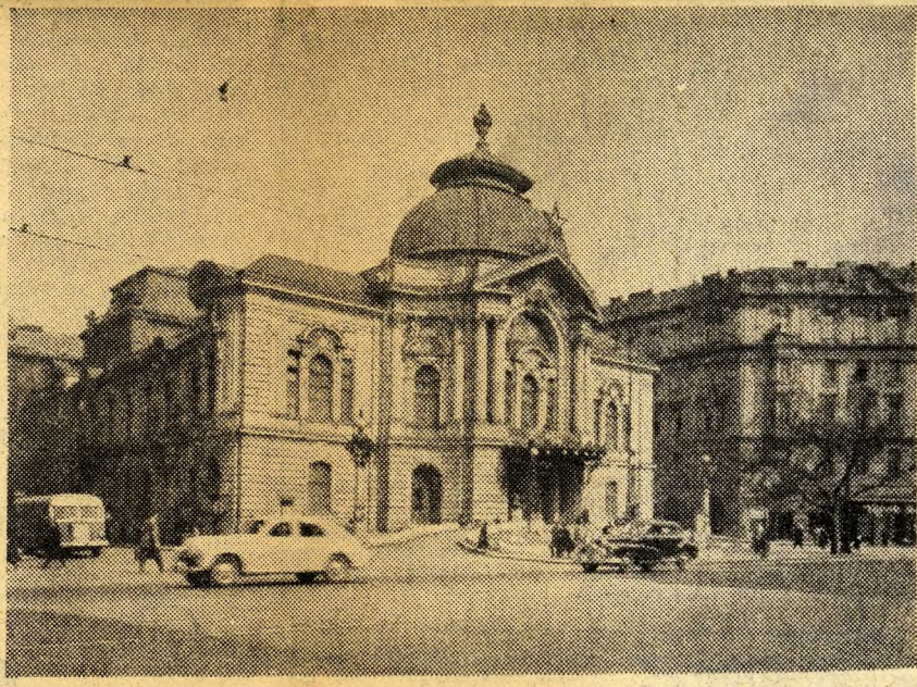
Néhány év mult el és felépült a Vígyszínház helyén a budapestiek egyik legkedveltebb szórakozóhelye, A Magyar Néphadsereg Színháza.