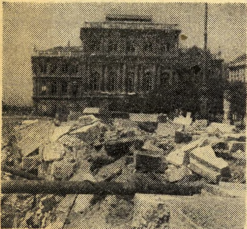
Ilyen volt 1945-ben a Magyar Tudományos Akadémia...