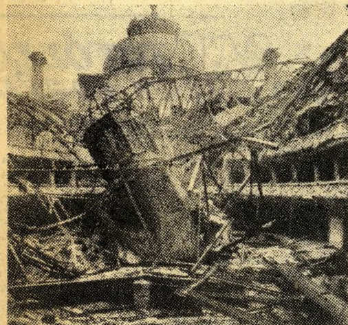
Ebből sem lesz már színház — mondták a budapestiek 45-ben a Vígyszínház romjait látva.