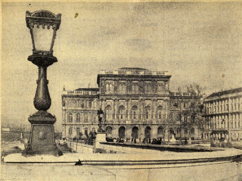
És így építettük újjá a Magyar Tudományos Akadémiát.