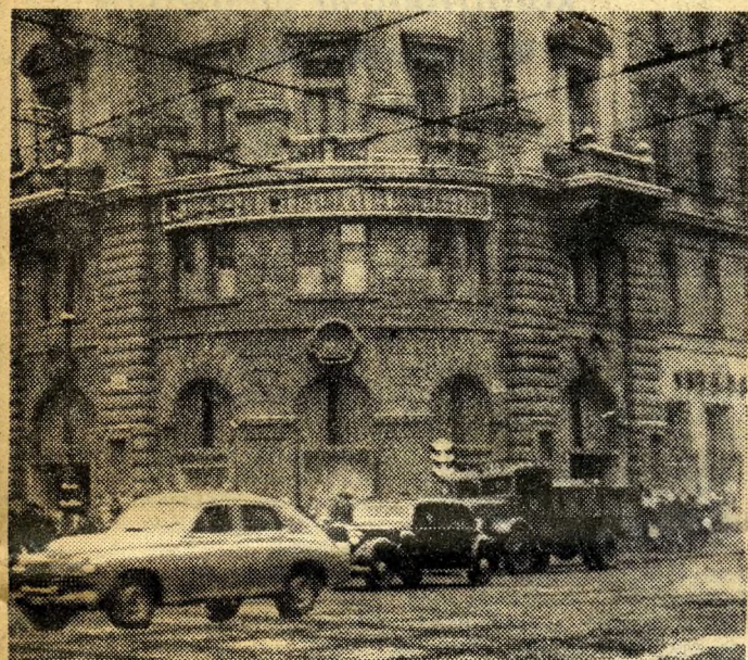
1955. január. Budapest legnagyobb élelmiszeráruháza, az Ejjel-nappal KÖZERT.

Az elmúlt tíz esztendő fényes bizonyítéka: Budapest szebb lett mint volt. A főváros népe élni tudott a szabadsággal.