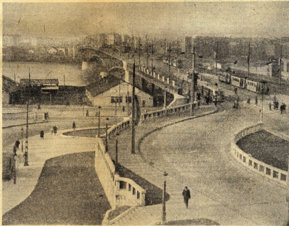
Ma a Petöfi-híd karsú ívei magasodnak a Duna felett. Az új híd fővárosunk egyik büszkesége.