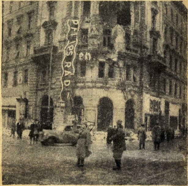
1945. január. A Rákkóczi út és Körút sarkán romokban a bankház.