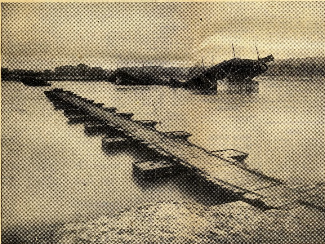
A fasiszták által felrobbantott Horthy Miklós-híd.