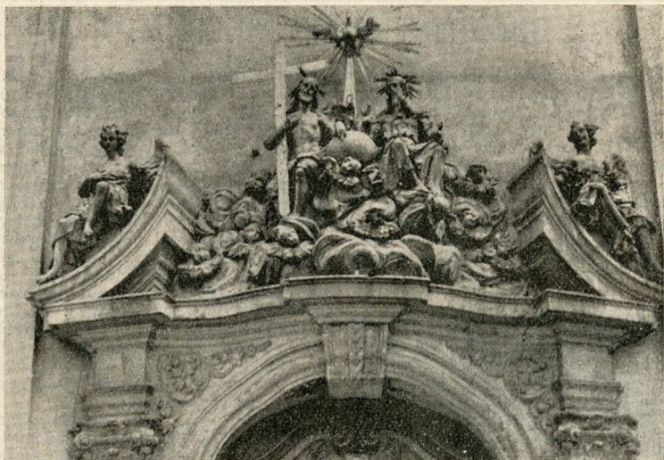
A Szentháromság szobra a belvárosi templom kapuja fölött.