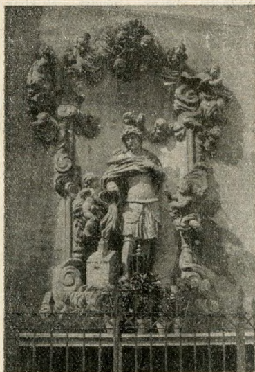
Sz. Flórián a belvárosi templom falán.

előkelősége tagja volt e társulatnak, melynek fővédője a király, második védője pedig a nádor volt; a társaság