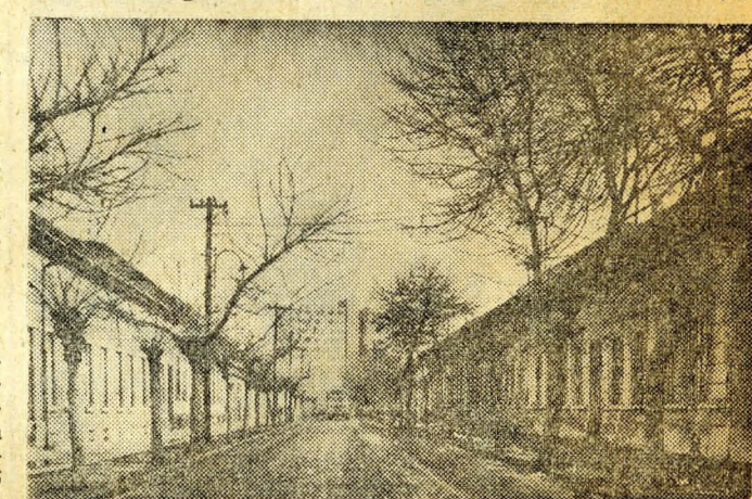
Lebontásra ítélt házak a Berda utcában

Csupán a vízvezeték bevezetéséhez több mint két évtized-re volt szükség. 1968 végére si-