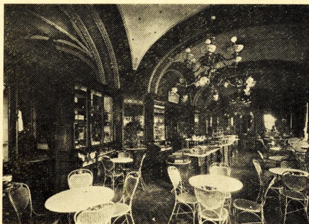
A régi Gerbeaud