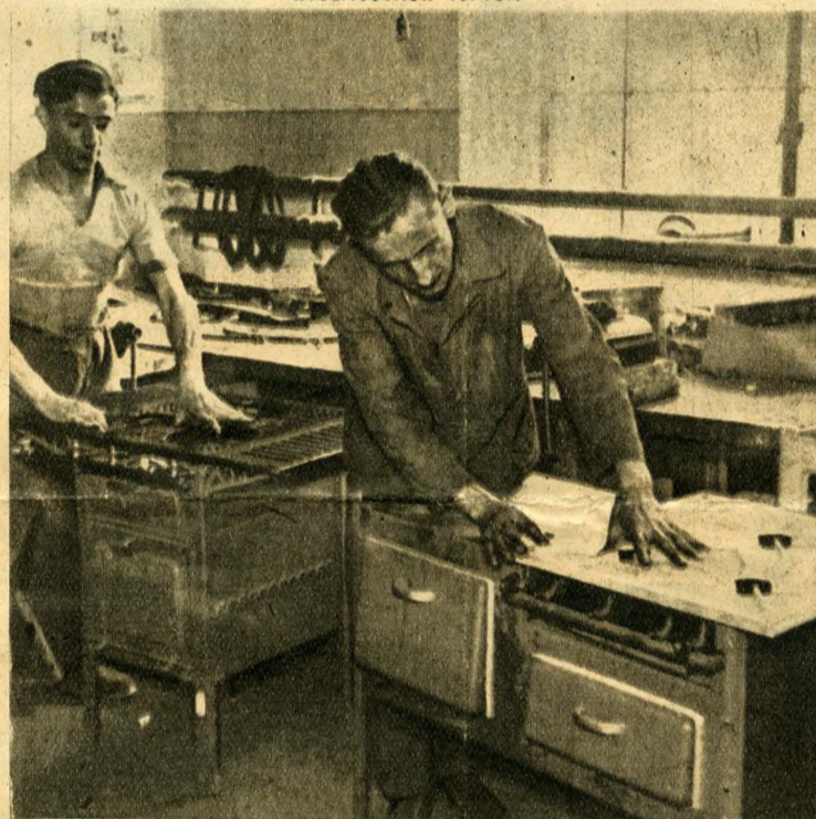
A Kísérleti Intézet új típusú gáztűzhelyen kísérletezik. A tűz- hely két sütővel készül. A kisebbik sütő a könnyebb tész- ták elkészítésére alkalmas. A háziasszonyok kényelmét szol- gálja majd a tűzhely alján elhelyezett kihúzható edénypolc és a főzőlap melletti ebonitasztalca, ahol előkészíthetik az edényeket a főzéshez. A vizsgálatok során megállapították, hogy az új gáztűzhely nagy sütője 50 százalékos, a kisebbik sütő 30 százalékos megtakarítást jelent a fogyasztók szá- mára. Az első mintadarabokat a Nemzetközi Vásáron mutatják be