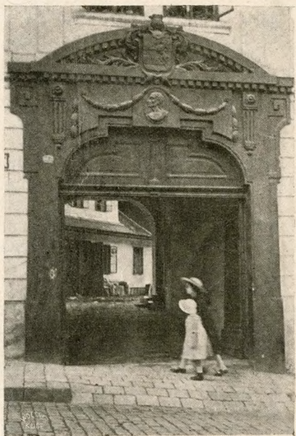
A Donáthi-utca egyik régi háza, faragott kapuval