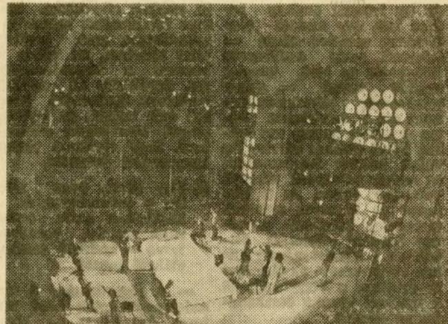
A mai Várszínház színpada