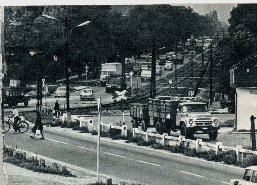
Túlterhelt forgalmi csomópont a szegedi és a bajai országút elágazásánál

népességének öt és fél százalékát alkotják, s a tervidőszak programja még csak azt a feladatot tűzi ki, hogy a gyerekek 40—45 százaléka kapjon helyet bölcsődékben.