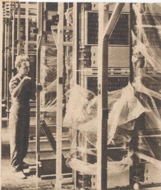
Részlet a Ferenc-központ szerelés alatt álló gépteremből. A képen látható gépkeretekre szerelik a különféle elektromos egységeket és a központ forgó mechanizmusát. A központ ugyanis forgó (rotary) rendszerű lesz, hasonló a többi hazánkban működő automata távbeszélő központhoz. A már felszerelt egységeket egyelőre műanyagfóliával védik a porosodás ellen.