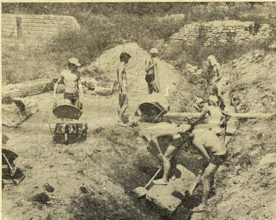
Aquincum, 1970. Francia diákok ásnak a polgári amfiteátrumban.

Aquincumban megnyílt a nemzetközi építőtábor. A magyar egyetemi hallgató-