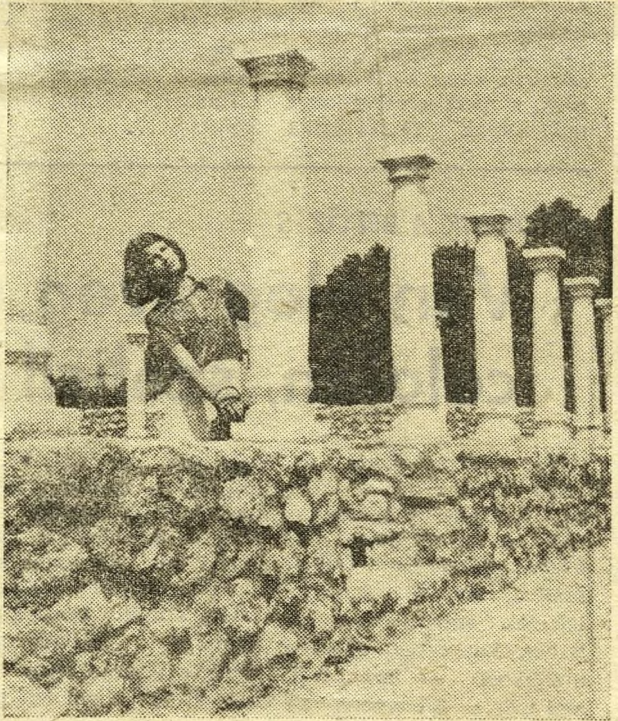
Aquincum, 1970. A Collegium Iuventutis oszlopsora

A polgárváros északi részén, közvetlenül a Szentendrei út mellett, megkezdték az aquincumi Fórum helyreállítását. A1