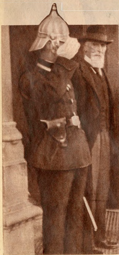
Apponyi Albert gróf a képviselőház kapujában.