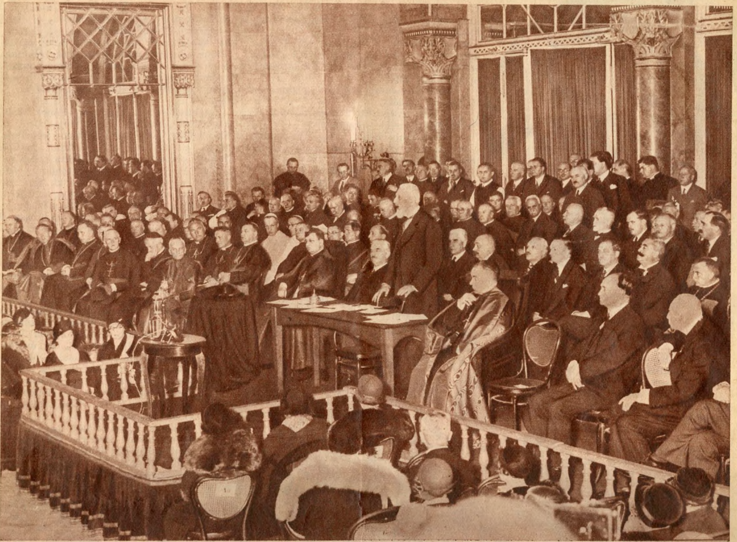
Apponyi Albert gróf mint a XXIII. országos katolikus nagygyűlés díszszónoka, 1932-ben, a Vigadóban.