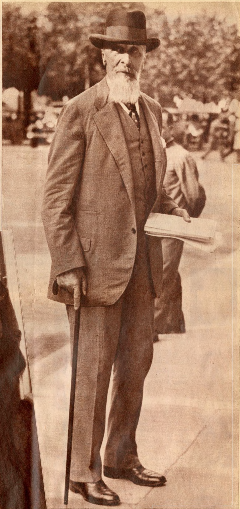
Apponyi Albert gróf 1929-ben megérkezik Genfbe a Népszövetség ülésére.