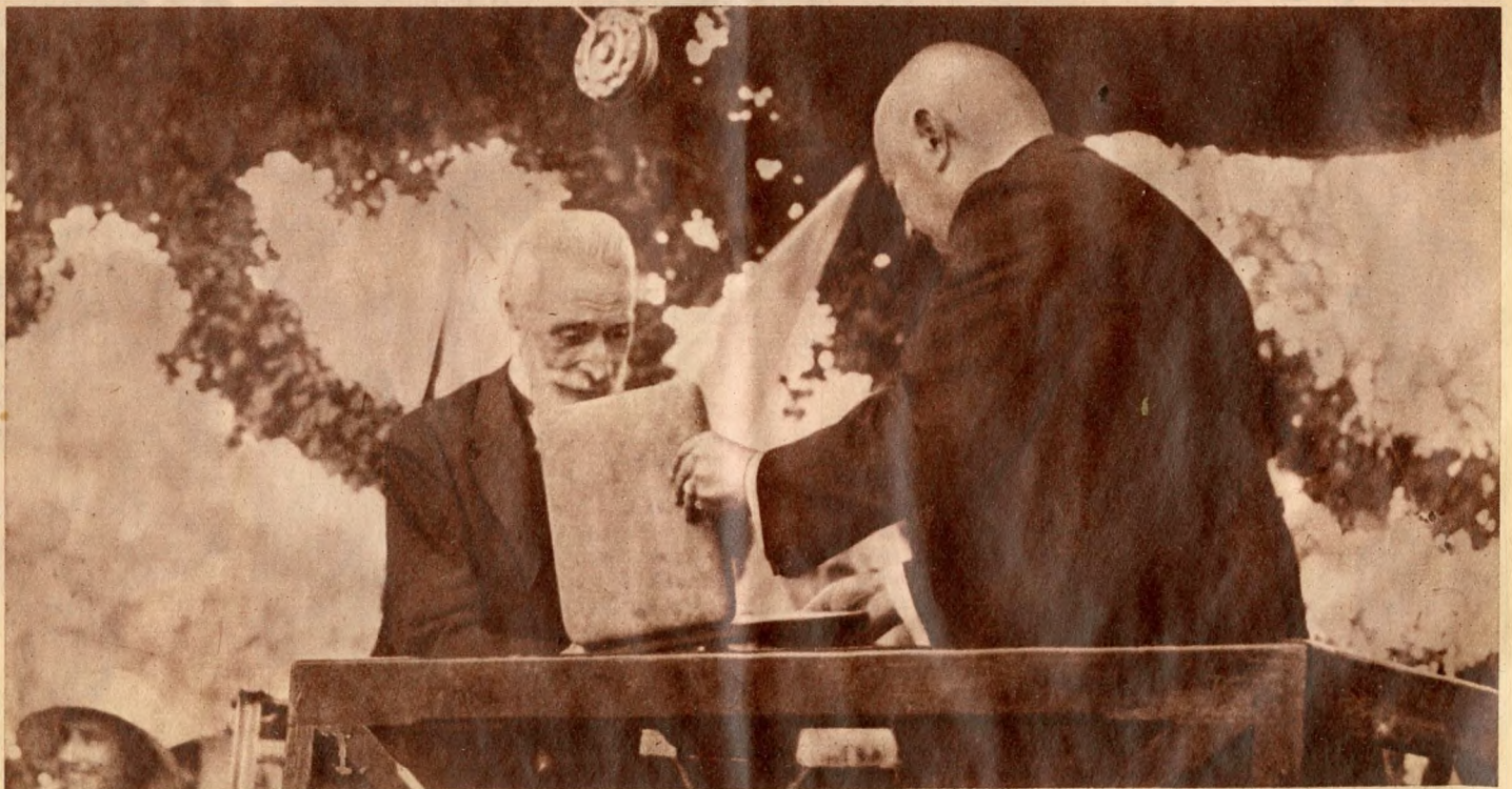
Az aranymandátum átvétele... 1931-ben volt 50 esztendeje annak, hogy Apponyi Albertet először képviselővé választotta a jászberényi kerület. Apponyi Albert gróf könnyezve vette át az aranymandátumot.