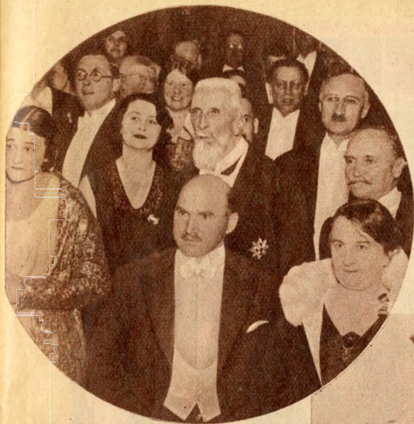
Apponyi Albert gróf ünneplése 85-ik születésnapján, 1932-ben.

— Költözzék át hozzánk Amerikába, mister Apponyi, mert nem bír el egy ilyen nagy embert egy olyan kicsi ország, mint Magyarország.