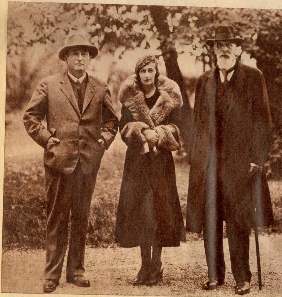
Apponyi Albert gróf 1932-ben Rómában, leánya és Gömbös Gyula miniszterelnök társaságában.