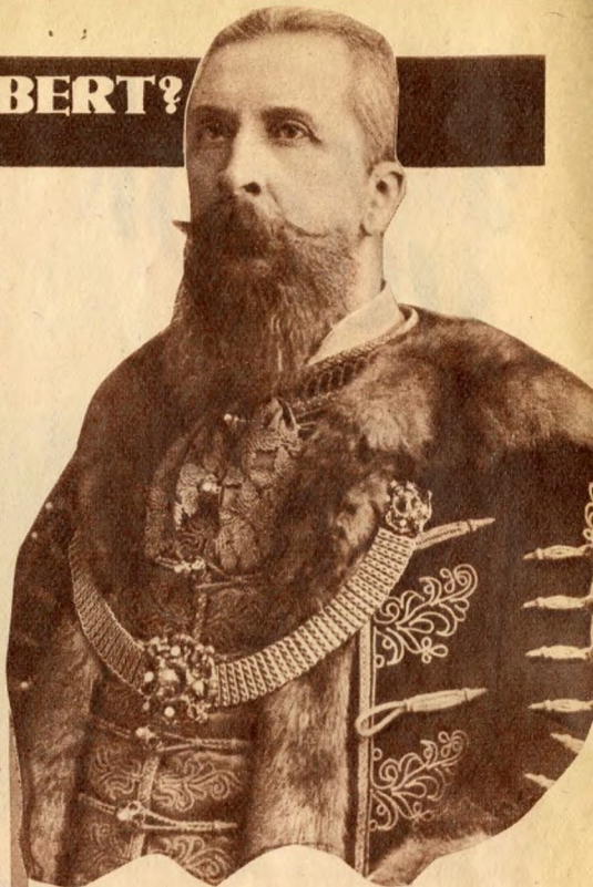
Apponyi Albert gróf, a kilencvenes években.

— Sohase vettem még zászlót, kortestollat sem választóimnak. Öt koronát szántam mindig kocsisoknak, öt koronát pincéreknek borralalól és tíz koronát bankett után a cigányoknak. Szégyeltem volna magamat, ha választóim pénzért, pörköltért,