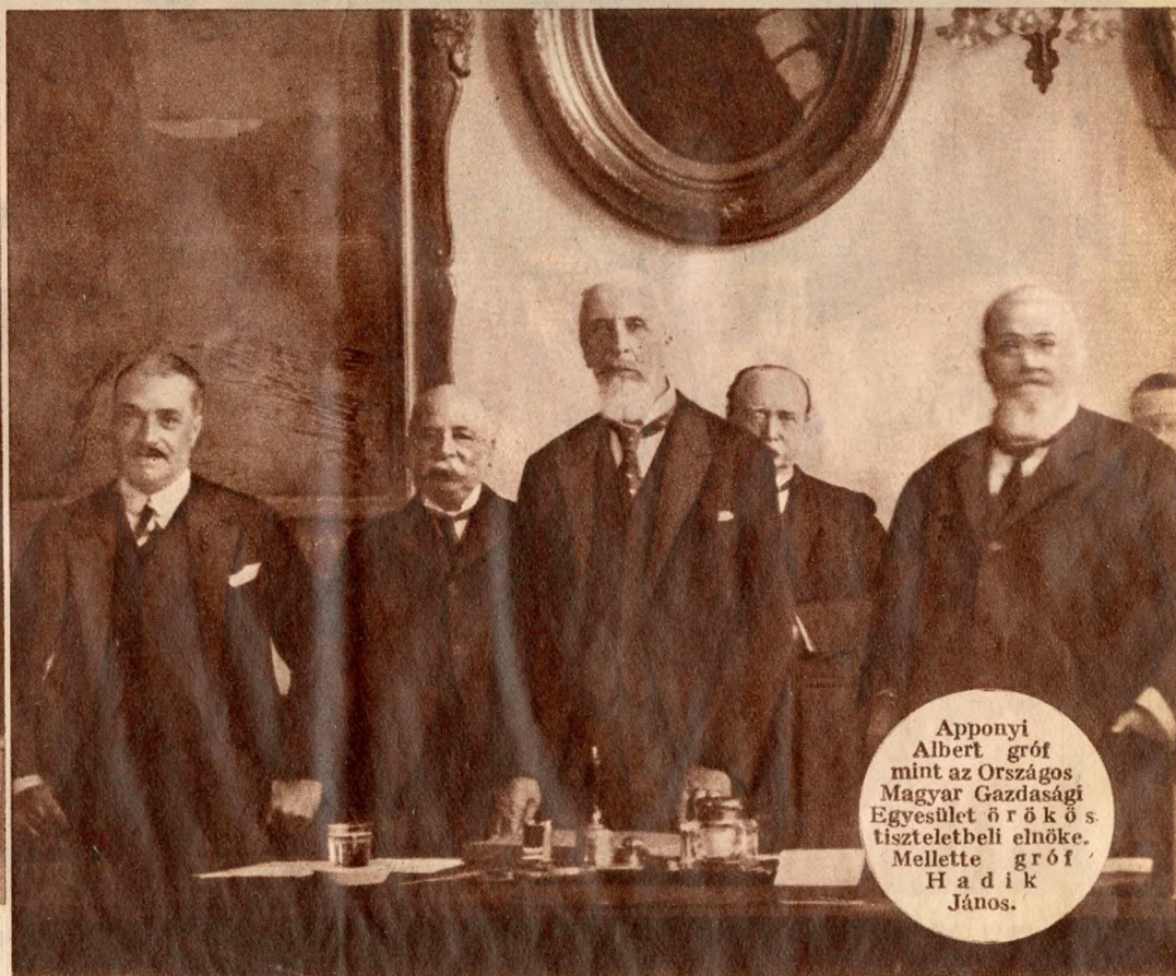
Apponyi Albert gróf mint az Országos Magyar Gazdasági Egyesület örökös tiszteletbeli elnöke. Mellette gróf Hadik János.