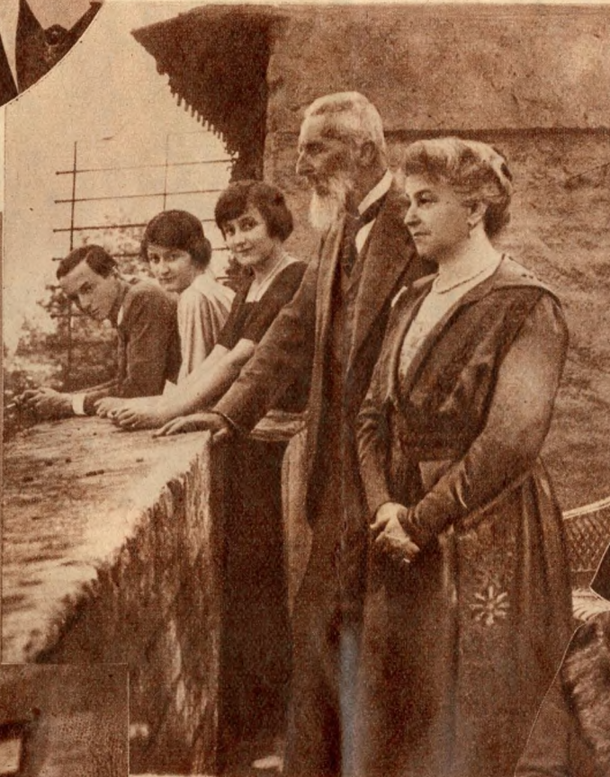
Apponyi Albert gróf családja körében.

— A legnagyobb tiszteletlenségnek tartom, ha egyes képviselők a törvényhozás csarnokában, ahonnan az egész országhoz szólanak, készületlenül beszélnek. Ha az ember leírja és megtanulja beszédét, azt mondja el, amit akar, nem mond többet és nem mond kevesebbet, nem bocsátkozik ismétlésekbe, beszédjének sorrendje van. Vagyis a készületlen ember beszéde olyan, mint amikor az ember gondatlanul öltözködik, a leírt és megtanult beszéd pedig elegáns ruhát húz a mondanivalókra.