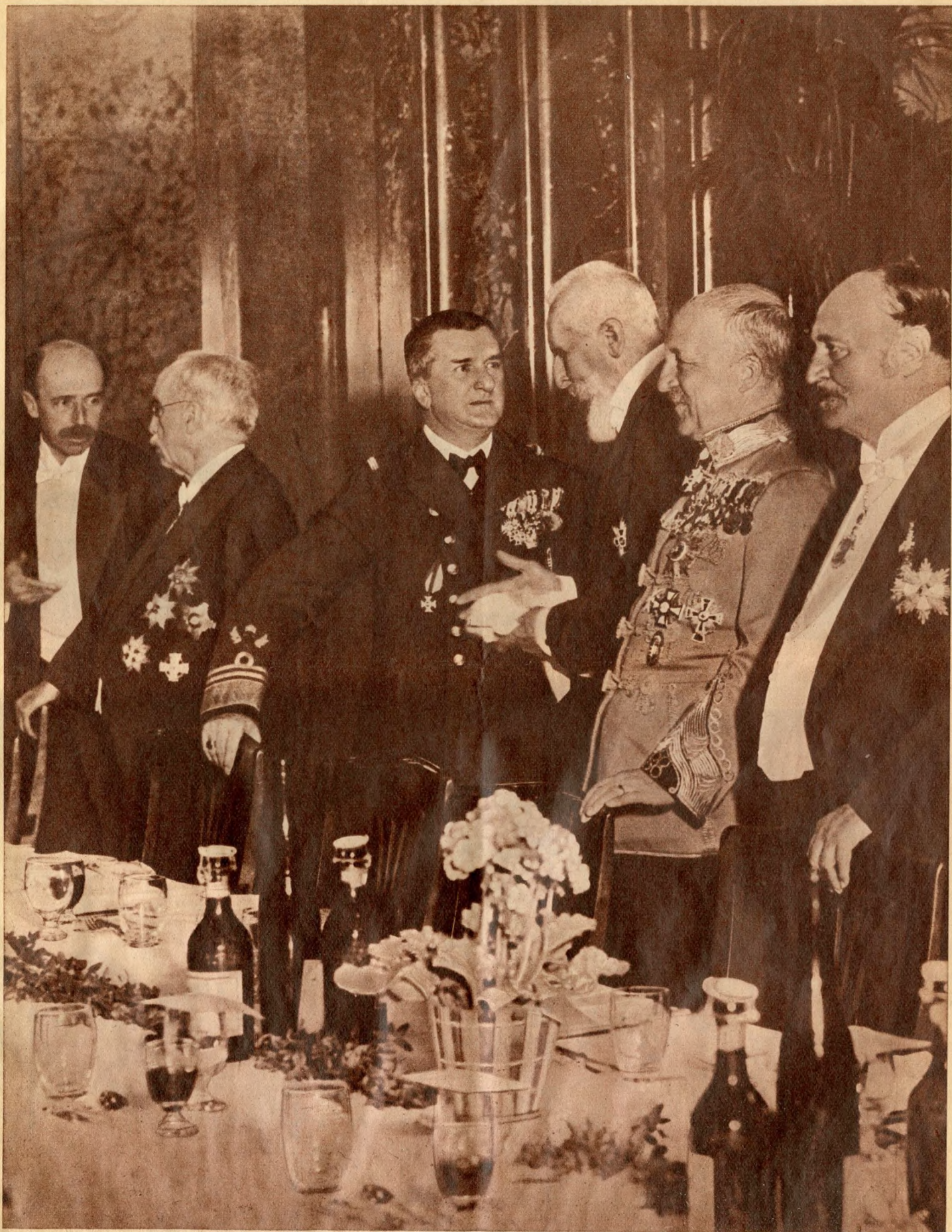
Apponyi Albert gróf Horthy Miklós kormányzóval beszélget az 1931-ben megtartott Tisza István-émlékvaesorán Balról jobbra: Bethlen István gróf, Berzeviczy Albert, Horthy Miklós kormányzó, Apponyi Albert gróf, József királyi herceg és Wlassics Gyula báró.