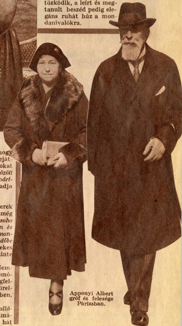
Apponyi Albert gróf és felesége Párizsban.