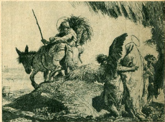
G. D. Tiepolo: Menekülés Egyiptomba.