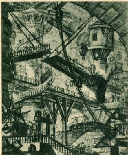
Piranesi: Börtönök c. sorozatából.