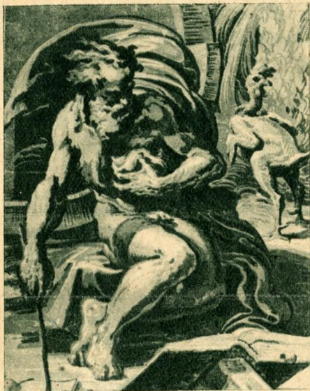
Ugoda Carpi: Diogenes.

veit nézi, akkor aligha kétségbe nem vonja az angol felsőbbiséget. Hogy az olasz grafika — különösen eleinte szorosan összefügg a piktúrával, az — az olasz festőművészet mindent beárnyékoló nagysága mellett — természetes. (Nem is szólva, hogy eleinte tisztán a nagy mesterművek népszerűsítését szolgálta, lehetővé téve, hogy a nagy mesterek óriási alkotásai, másolatok révén, kispolgári otthonokba is eljussanak.) Ismeretlen firenzei rézmetszők nyitják meg a sorozatot, műveikben elragadóan keveredik a szemlélet, a kompozíció hamvas naivsága a javítási lehetőségeket meg nem engedő anyag adta biztos technikai tudással. Köztük van egy „koronát tartó szerelmes pár“, melyre, mint egyetlen (egyetlen ismert) példányra az illusztris rendezők igen büszkék (valószínűleg a gyűjteménnyel való odaadó és szeretetteljes munka következtében az elfogultság), de amelynek merev, fantáziátlan gyerekrajzra emlékeztető primitívségében, szépet semmit se tudunk fölfedezni. Idő nem sok, de fejlettség annál több választja el ezektől Pollainolo „Meztelen férfiak harca“