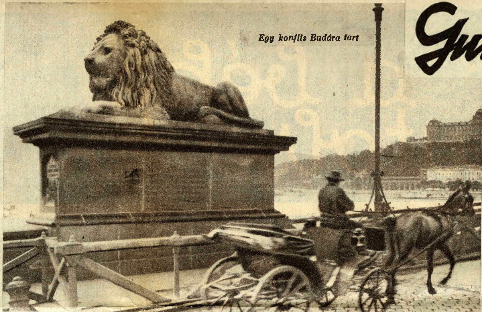
Egy konflis Budára tart