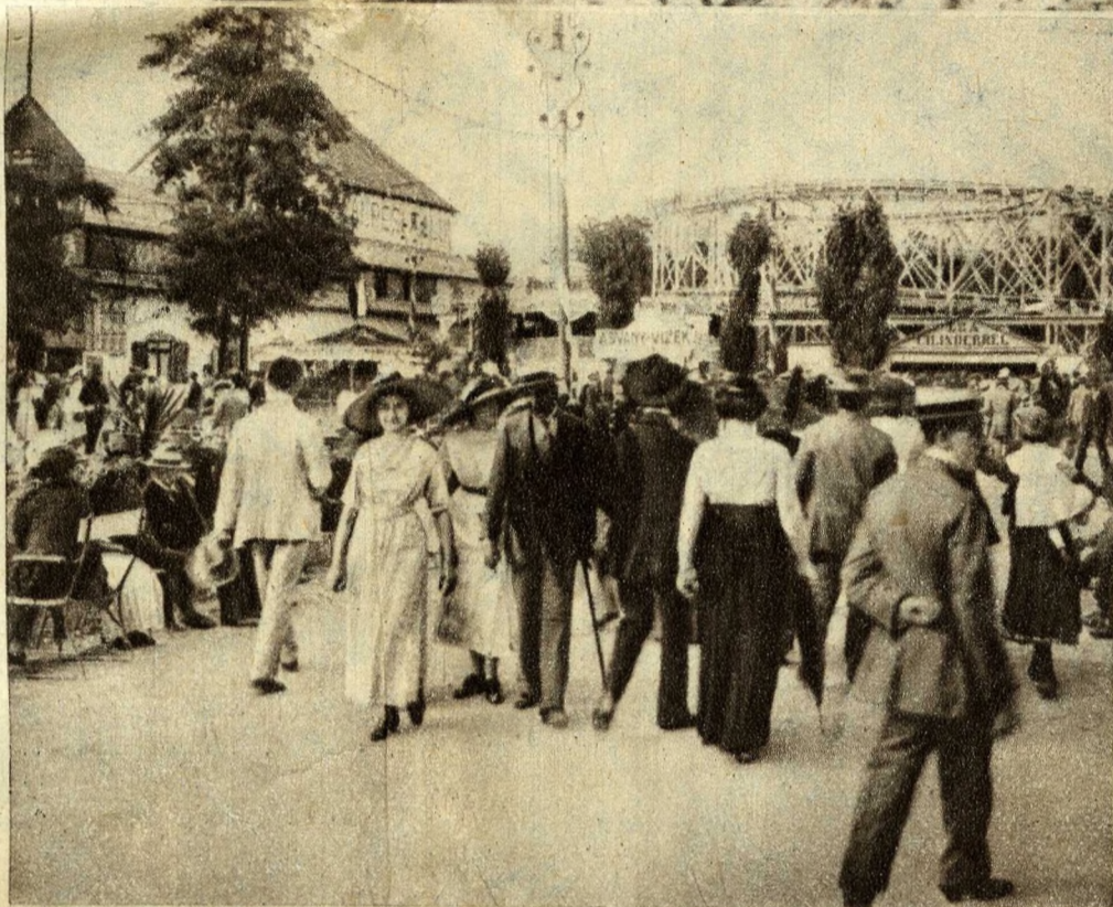
Séta az Angolparkban