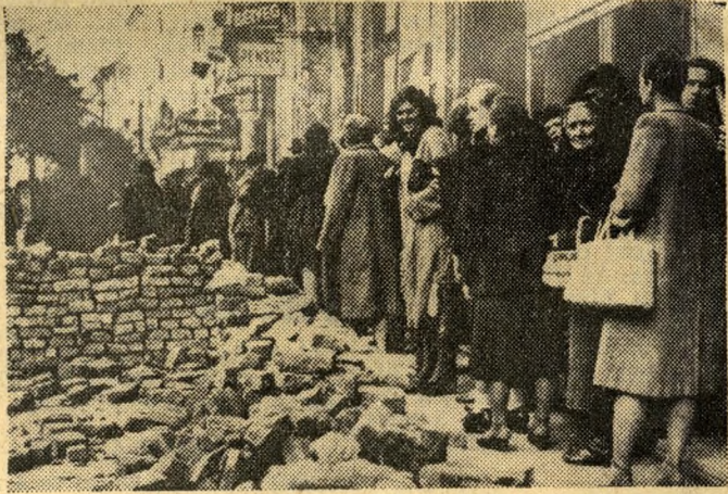
Rombadöntött fővárost, éhező, rongyos embereket hagyott ránk a múlt átkos rendszer. De olyan várost és olyan embereket, akik előtt már megnyílt a jövő...