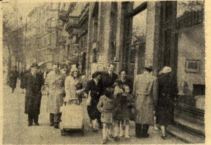
A rombadöntött várost újjáépítettük, ismét hidak feszülnek a Duna fölött, eltűntek a foghíjak a város legtöbb részén, Budapest már eddig is szebb lett, mint valaha volt...