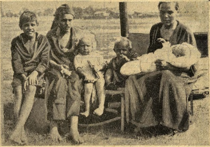
... mert a régi rend ezt a sorsot szánta a dolgozó embereknek. Embertelen robot — s érte éhber, kilakoltatás, jogtalanság és kilátástalanság volt a proletár osztályrésze...