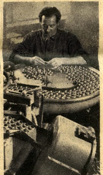
Jó gép, tiszta műhely, embertisztító munkakörülmények. Miénk a gyárak, úgy rendezzük őket, hogy életünket szolgálják. S úgy, hogy több, olcsóbb termékkel erősítsék a nép országát.