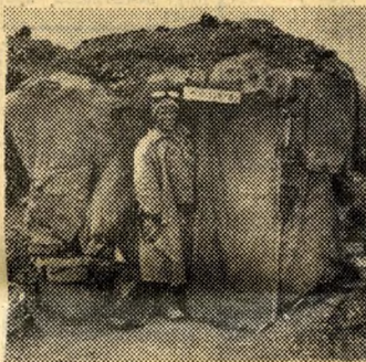
... lakás? Kunyhó a Cséritelepen, rongyokból összetákolts viskó a szeméthegegyek tövében...