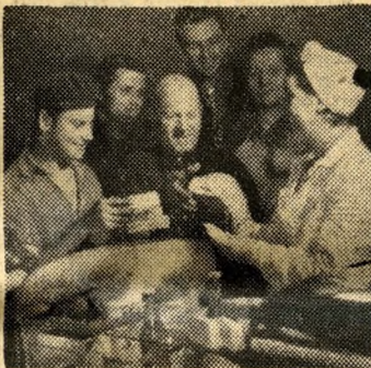
... a gyárban pedig üzemi büfé várja a munkában megéhezöket...