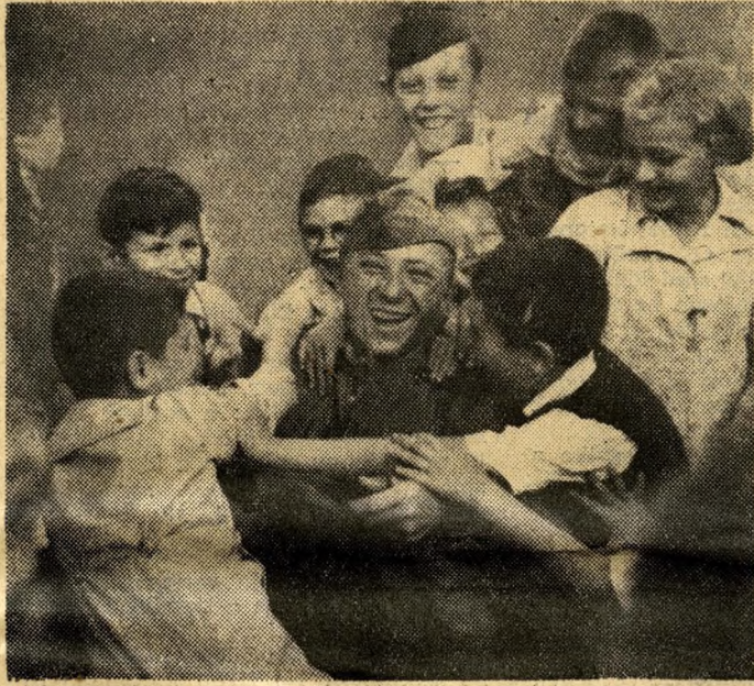
Köszönet a felszabadítóknak

Az ünnepi órák népeink visszagondol múlt évtizedére. A harcokra, a győzelmekre, a küzdelmekre, amelyeket önként vállalt — s a pártra, szabad életünk őrzőjére, lelkiismeretére. S úgy gondolunk vissza, hogy még szorosabban zárjuk sorainkat a párt, a Központi Vezetőség körül — hisz csak így tudjuk elérni céljainkat, s tudunk még többet tenni népünk életszínvonalának növeléséért, eredményeink gyarapításáért; csak így oldhatjuk meg gondjainkat, nehézségeinket, az előttünk álló sok és nehéz feladatot.