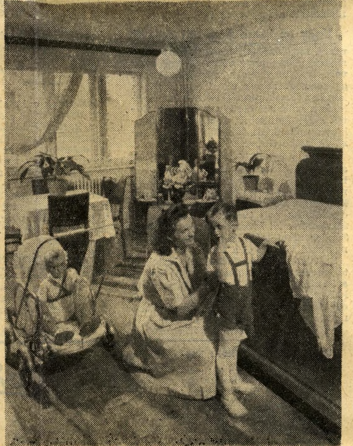
... s benne az emberek másként, jobban élnek, mint bármikor. Új lakások sora, szép napfényes otthonok teszik emberibbé az egykori nyomortelepek proletárainak életét...