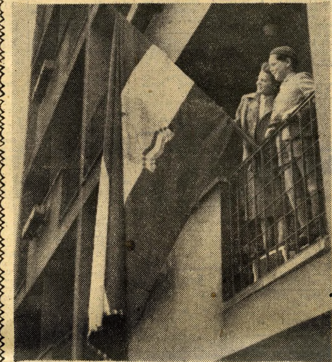
Az ünnepre díszítik a budapesti gyárakat, lakóházakat