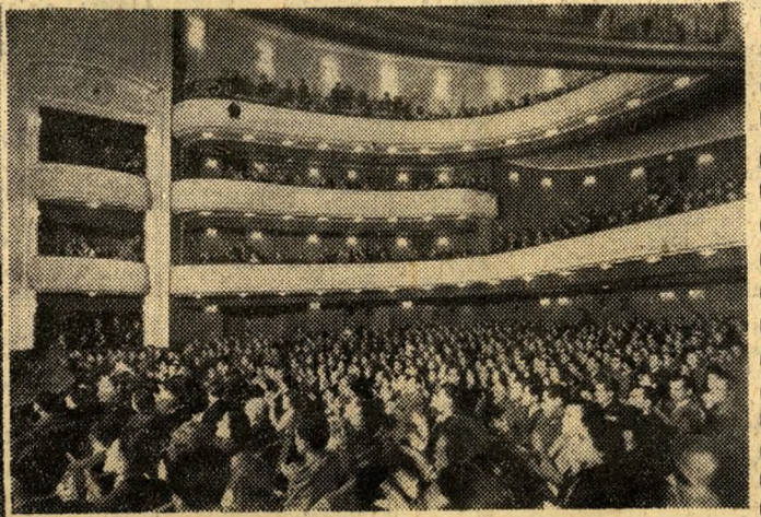
... közkincsé vált a kultúra, a tudomány, a művészet — az élet minden szépsége, amely valaha csak a kiváltságosaké volt.