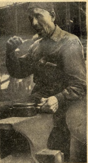
... üzemi ebédlő, gondoskodás, munkásvédelem? Mindebből nem jutott több, mint a sőtét műhelysarok, a kovács-ülő...