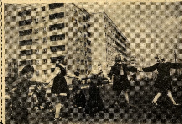
Szép lett fővárosunk. Új lakótelepek festettek új, egészséges színt arcára...