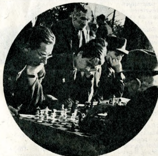
Itt a tavasz, „kivirágzottak” a téri sakkpartik is

De a kert mögötti városnegyed már nem a régi. Nem külsőleg értendő ez, belső a változás. A kis-