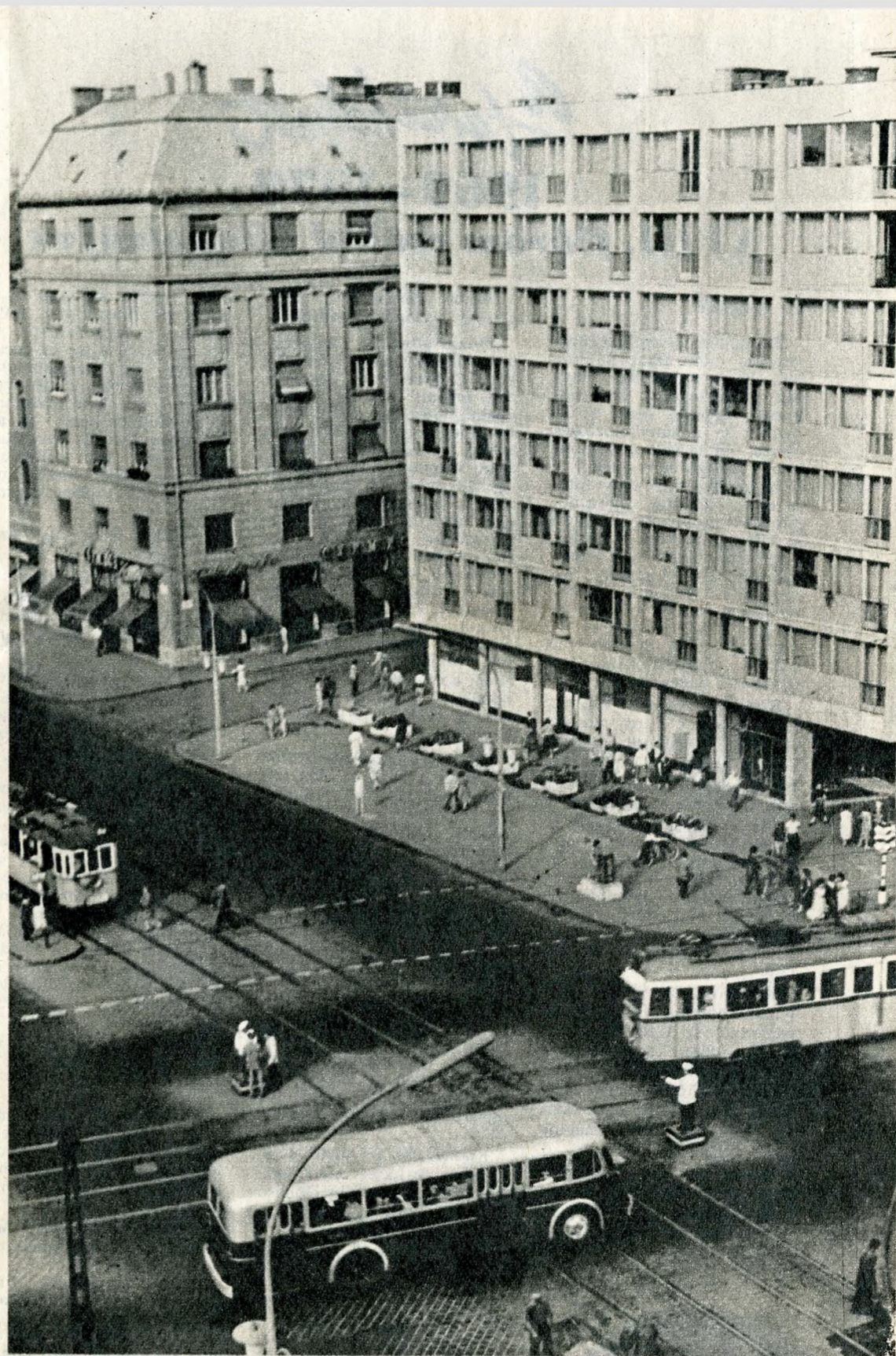
A Körút és az Ullői út találkozása, a ferencvárosi „határmezsgye”. Lent: A régi bérkaszárnnyak fölé már az új magasház emelkedik

És mi van az „igazi” Józsefvárossal, azzal, amely a Körút palotái mögé bújva a régen fényhez sem igen jutó girbe-gurba utcákban húzza meg magát, a Körúttól a Kálvária térig, a Népszínház utcától a Práter utcáig? Ez a vidék várja az igazi megfia- talodást, hiszen rászolgált régóta. Vagy 4000 la- kás épült egy negyedszázad alatt a Józsefvárosban, de mind kevés. Igen, az igazi változás majd itt lesz e rozszant viskók, a „házmatuzsálemek” vidékén. Hogy milyen lesz ez az új, szabadon lélegző Jó- zsefváros? Aki kíváncsi rá valóban, menjen le a Tömő utcába, az ott lebontott öreg épületek he- lyén már állnak az első modern házak. Átalakul ez a vidék röpke pár esztendő alatt. A Práter utca belső útvonalallá rúkkol elő. A Práter utca és az Il- lés utca sarkán három magas ház emelkedik nem- sokára, s mögöttük iskola, óvoda, bölcsőde. Miként egy győztes sereg az ellenséget, úgy tűnteti el az előre nyomuló szanalás lassan-lassan e kis házak nyomasztó rengetegét, kifelé haladva egészen a