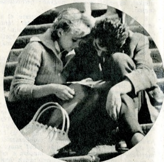
Itt a múzeumlépcsőn

A Múzeumkert is olyan mint régen. Darabka li- get, oázis a város közepén. Közönsége sem válto- zott, legfeljebb gyarapodott. Reggel, amikor erősö- dik a napfény, a legapróbbaké. Anyák gyerekkö- csit tologatnak, nagyapák vezetnek kézen fogva az unokákat. Aztán hirtelen — legalábbis úgy tűnik hirtelen — benépesedik a múzeumlépcső. Diákok-