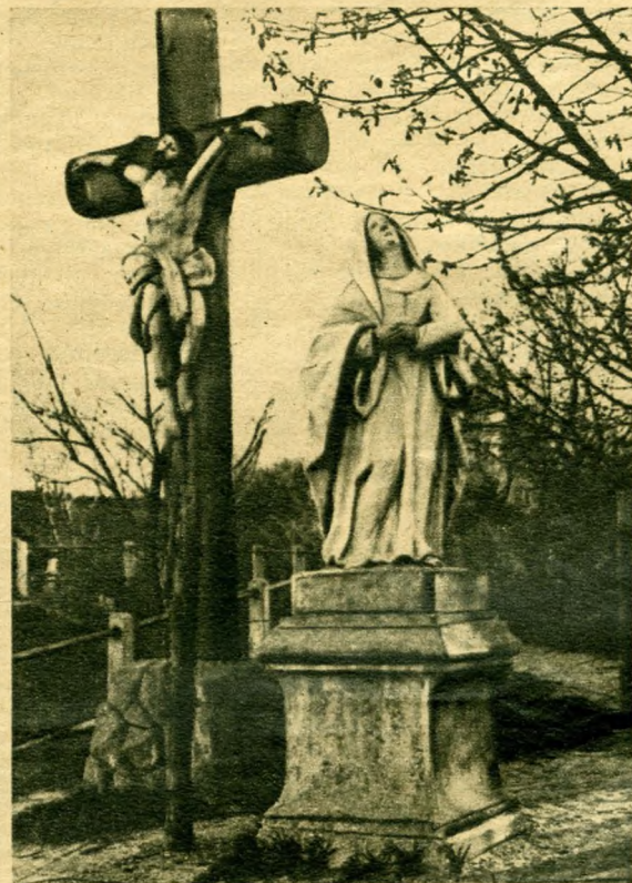
Az óbudai kálvária két részlete. — Alsó képek: az óbudai kálvária, jobboldalt a Gellérthegy kálvária.