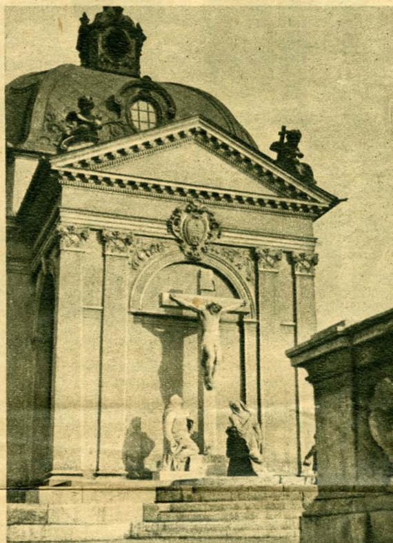
Az epreskerti kálvária maradványa. — Jobboldali kép: a Golgota-úti kálvária.