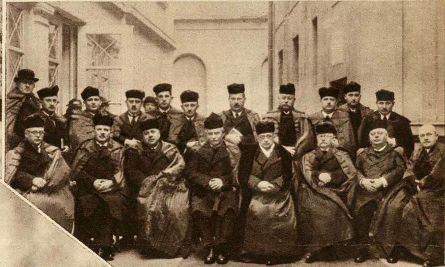
A dunameliéki református egyházközség közgyűléséről