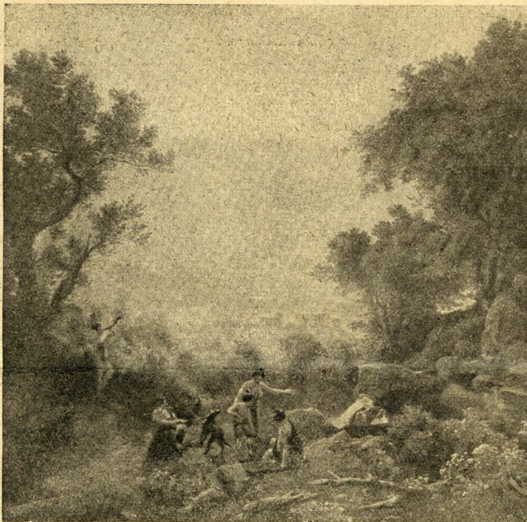
Id. Markó Károly: Diána vadászaton.