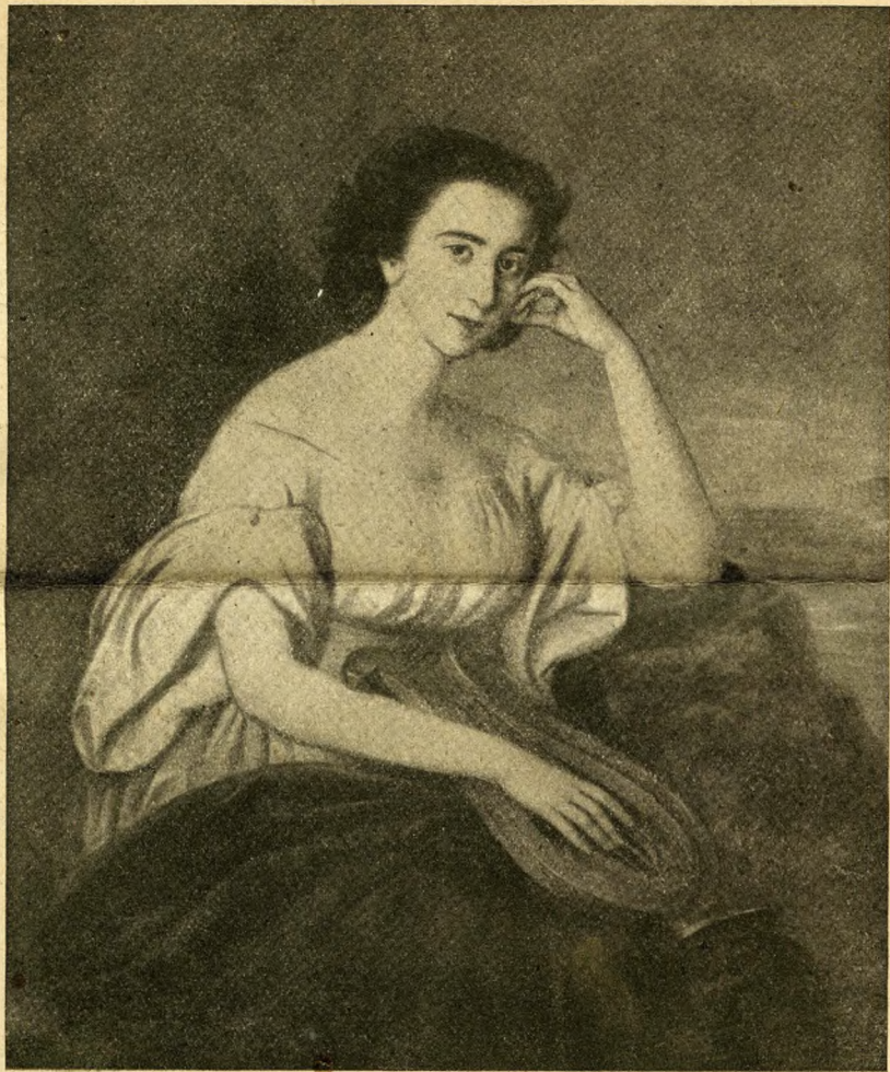
Orlay-Petrich Soma : Sappho.