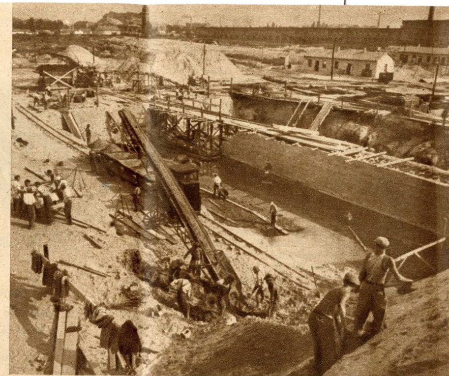
FOLYIK A MUNKA a régi lóversenyterren, megalapozták a Népstadion hatalmas épületét