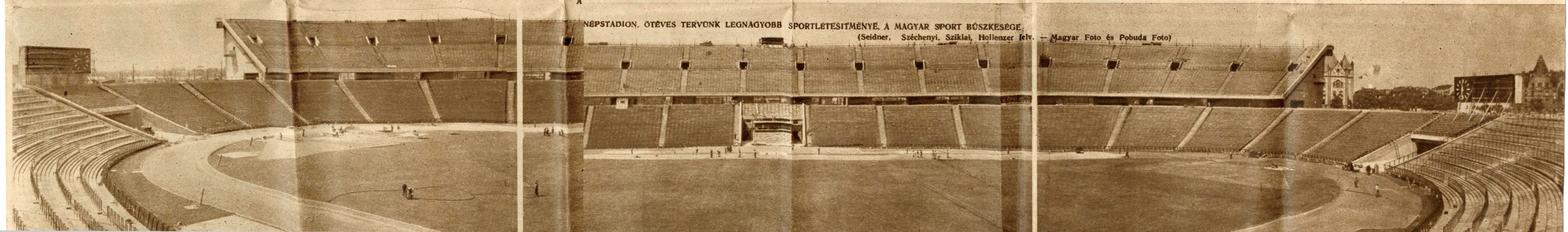
NÉPSTADION, ÖTÉVES TERVENK LEGNAGYOBB SPORTLETESÍTMÉNYE. A MAGYAR SPORT BÜSZKESEGE