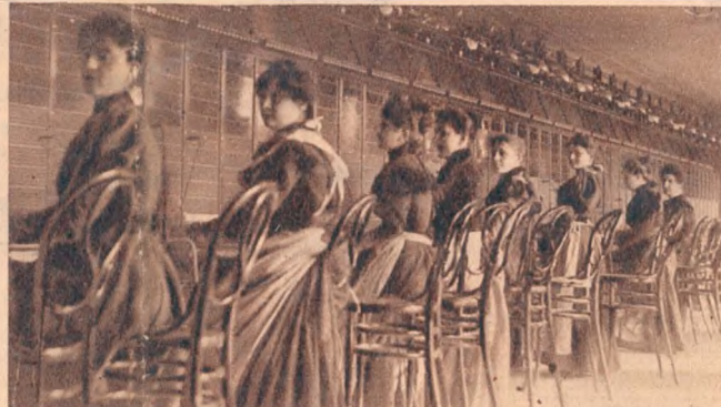
A szerecsenuccai telefonközpont, ahol a telefonoskisasszonyok még egyenruhát viseltek. Kék ruhát és pirosorrú sárga cipőt. Azért öltöztették őket így, nehogy hivatalos óra alatt az uccára mehessenek.