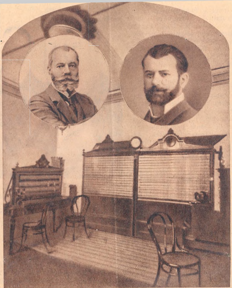
Az 1881-ben, a Fűrdő uccában felállított első telefonközpont. Fent a magyar távbeszélő alapítói: Puskás Tivadar (balról) és Puskás Ferenc (jobbról).

Milyen volt ez a telefonközpont? Hatalmas elektromos automataberendezésekről természetesen még szó sincs. Mindössze pár telefonoskisasszony várja a forgalom megindulását. Az első napon mindössze 54 előfizetője van a magyar telefonnak. Pár állami hivatal