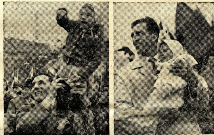
Apák és gyermekek.