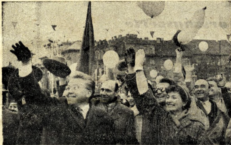
Vonulnak a Nemzeti Színház tagjai.