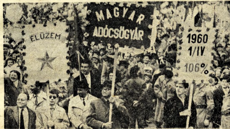
Az élüzem Adócsügyár dolgozói.