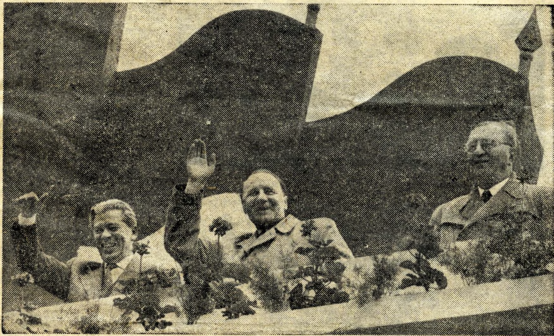
Marosán, Kádár és Münnich elvtársak az emelvényen.