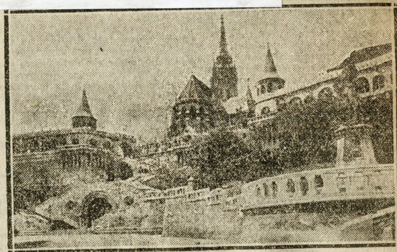
Budapest: Bastione dei Pescatori