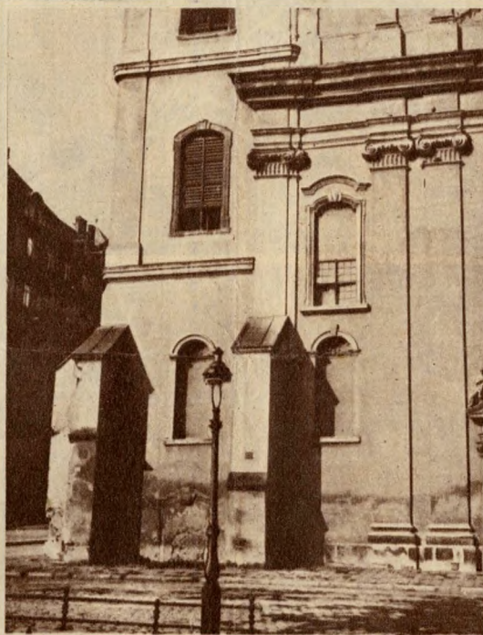
A barokk homlokzatból erőteljesen ugranak elő az eredeti gótikus tornyok támasztó pillérei.

S ezekkel a koronként megismétlődő „renoválásokkal” a későbbi kor mindig igyekezett jobban magáévá tenni a régi épületet. A hódítás szelleme vezérelte mindig a renoválókat. Nem volt sok tisztelet bennük a régi stílusokkal szemben. Nem is tudtak belehelyezkedni az övétől eltérő gondolkodásba, mely esetleg épp ellenkezőképpen fogta fel a szépség alapszabályait. A gótikát, a középkori keresztény művészet legnagyobb stílusát, a renaissance idején barbárnak tartották. Ezért kapta a gót nevet is az egész építészeti stílus. Le-