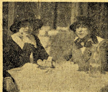
Reggeli a ligetben.

A budai részekén a május-ünnep kezdetének ugyanezek voltak a kül- sőségei azzal a kis különbséggel, hogy nem hiába választja el a Du- na széles medre a két testvérvárost egymástól s nem hiába, hogy Buda mindig a konzervatív erőnek volt az ősforrása. Valami olyan történt ugyanis tegnap Budán, — naiv és kedves dolog — aminek Pesten nyomát sem lehetett találni. Itt nemcsak katonazenével, sipolással és túlköléssel ünnepelték a tavasz jövetelét, hanem májusi fákkal is, ami ismét azt jelenti, hogy a bu- daiaknál még mindig százszorta több az érzékenység és a helyiérdekű alkalmasság a poézis gyöngédsége iránt, mint a modern pestieknél. A budai népek lakásai előtt a Krisz- tinavárosban és a Várban gyönyörű májusi fák bókoltak s ami szintén a régi Biedermeier-romantikának ked- ves maradványa, az éjszaka csönd- jében egy-egy feketeszemű, karsu szépségnek éjjeli zene alakjában panaszolta el megmarcangolt ideáljai kiolthatatlan epekedéseit.