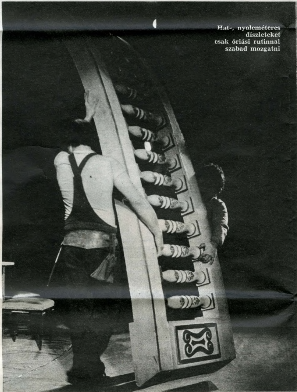
Hat-, nyolcméteres díszleteket csak óriási rutinnal szabad mozgatni