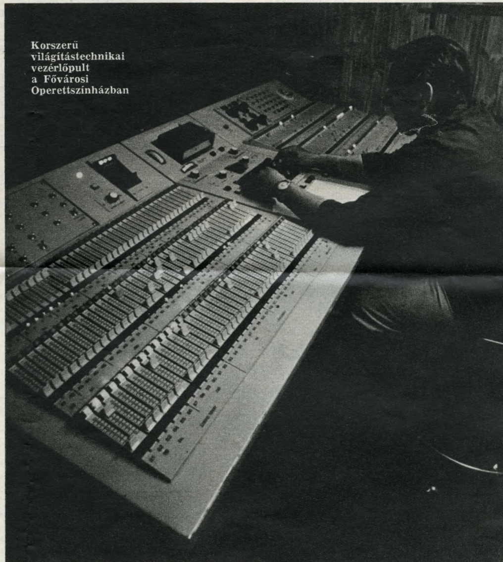
Korszerű világítástechnikai vezérlőpult a Fővárosi Operettszínházban

tó elő- és oldalszínpadokra, hidraulikus emelőkre, csodaszerkezetekre? Egyik-másik agyongépesített színház vajmi kevés művészi sikert könyvelhetett el eddig, ugyanakkor híres társulatok dolgoznak viszonylag puritán körülmények közt. Az abszolút példaként emlegetett új, londoni Nemzeti Színházról is kiderült, hogy sem az alsó, sem a felső gépezet nem működik!