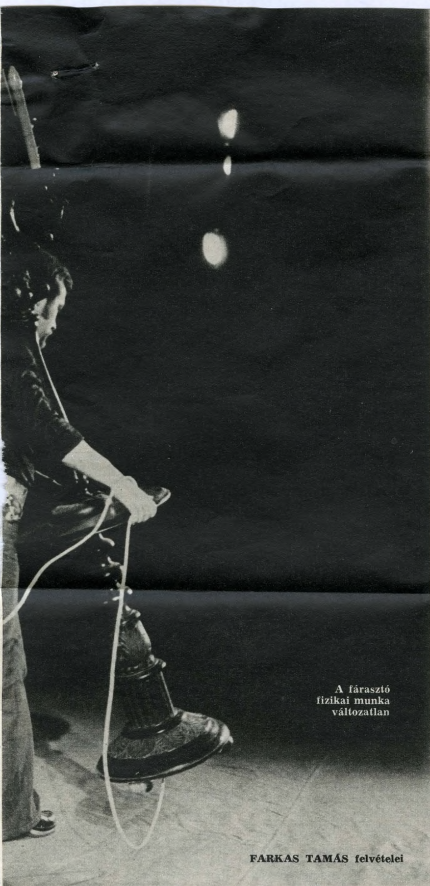
A fázasztó fizikai munka változatlan