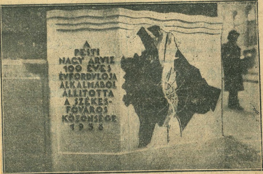
A NAGY PESTI ARVIZ SZAZADIK ÉVFORDULÓJA ALKALMABÓL EMLÉKTABLÁT ILLESZTETEK A KÖZPONTI EGYETEM FALÁBA. A KŐBE VÉSETT TÉRKEP FELTÜNTETI A TENGERRÉ SZELESE-DETT DUNA ÁRTERÜLETÉT.