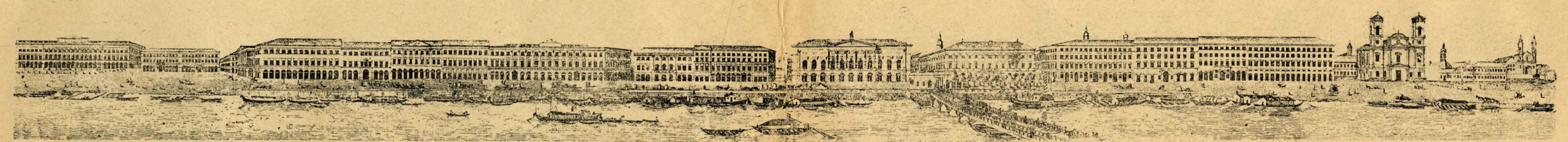
Pesti korzó az 1830-as években