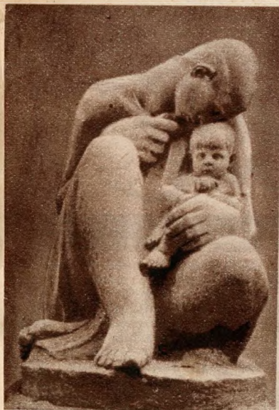
Csésátka Ottó: Az anya

1385 — All. Karpinszky-nyomda, Vig-utca 6.