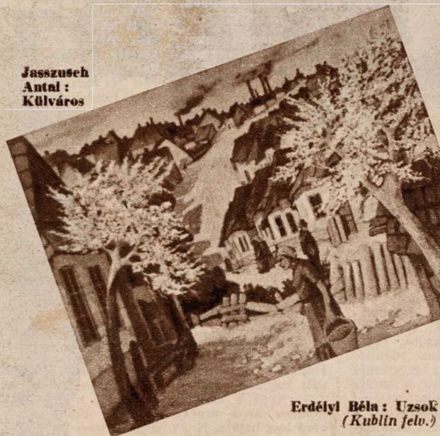
Erdélyi Béla: Uzsok