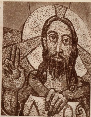
Jakoby Gyula: Krisztus (Mozaik)