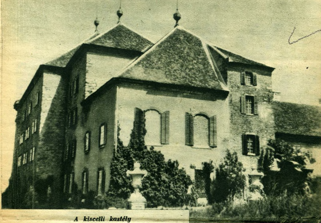
A kiscelli kastély

Mint az Ujság jelentette, Schmidt Miksa, a Budapesten elhunyt gazdag butorgyáros kiscelli kastélyát, a benne lévő műkincsekkel együtt a fővárosra hagyta azzal, hogy iparművészeti muzeumképpen kell fenntartani. A kastély eredetileg trinitárius templom és kolostor volt. Gróf Zichy Miklós, Óbuda egykori földesura építtette, akit 1758-ban benne is temettek el. A kastély méteres vastag falai, egyszerű vonalai és arányai megbízhatóságot és maradándósá-