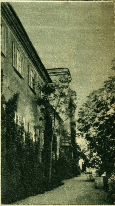
A kastély keleti homlokzata

got lehelnek. Van e tisztos épületben valami várszerű; olyan a kastély, mint egy évszázadokkal dacoló vár. Később csakugyan a katonaság kezébe került, majd egy ideig rokkant katonák menházául, azután katonai ruharaktárul szolgált, míg most a főváros muzeumává alakult át.