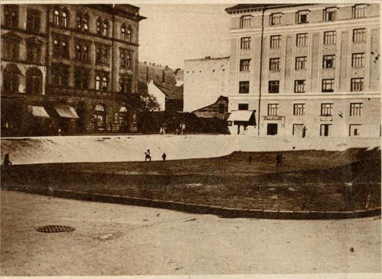
Balra: A papok egykori halastavának maradványa, gödör a Práter-utcában.