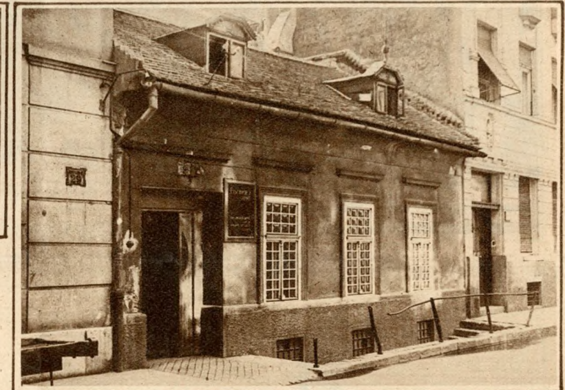
Jobbról: régi manszár-dos ház a Hungadi-utcában.