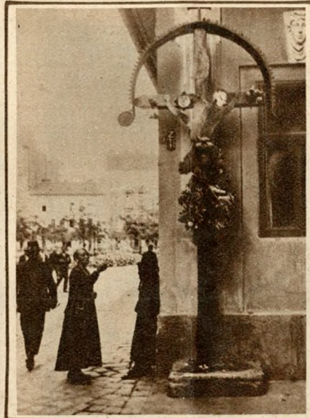
Régi kereszt a Koszoru-utca sarkán.