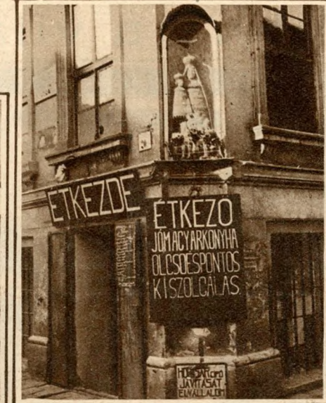
Mária-szobor üveg alatt, az Óriás-utcában.