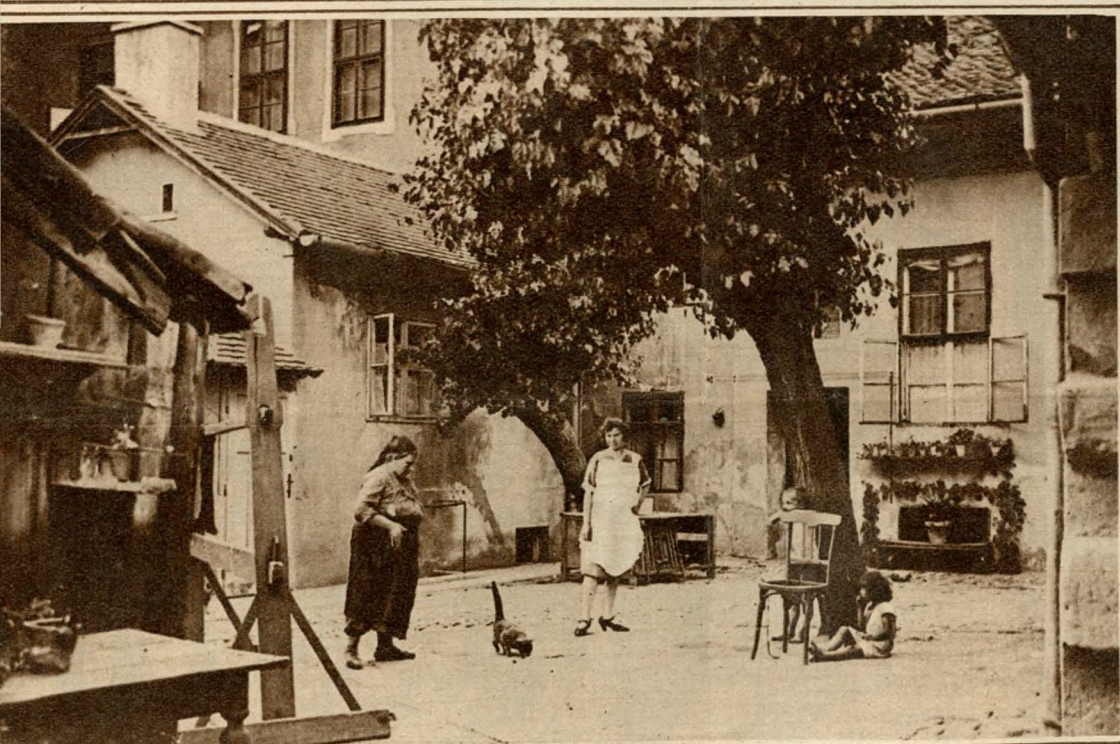
Kispolgári ház udvara.