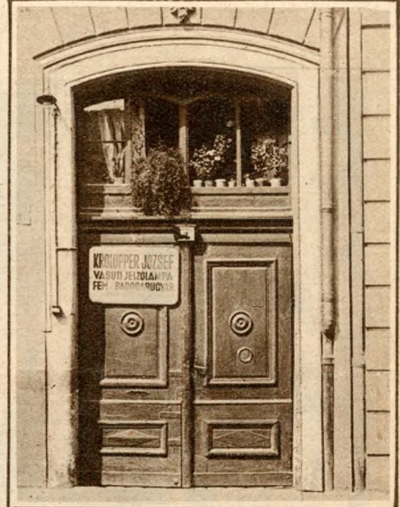
Padlásszoba a kapu felett.