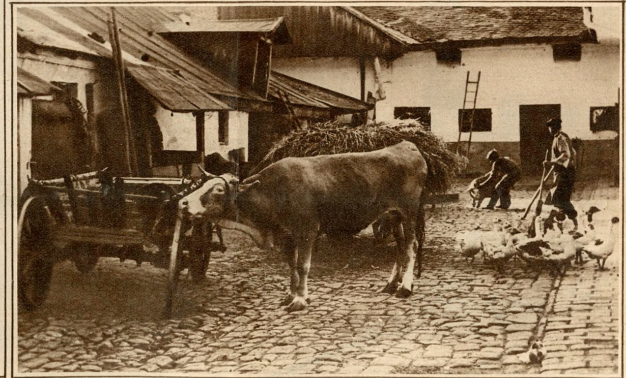
A millimáris udvara.