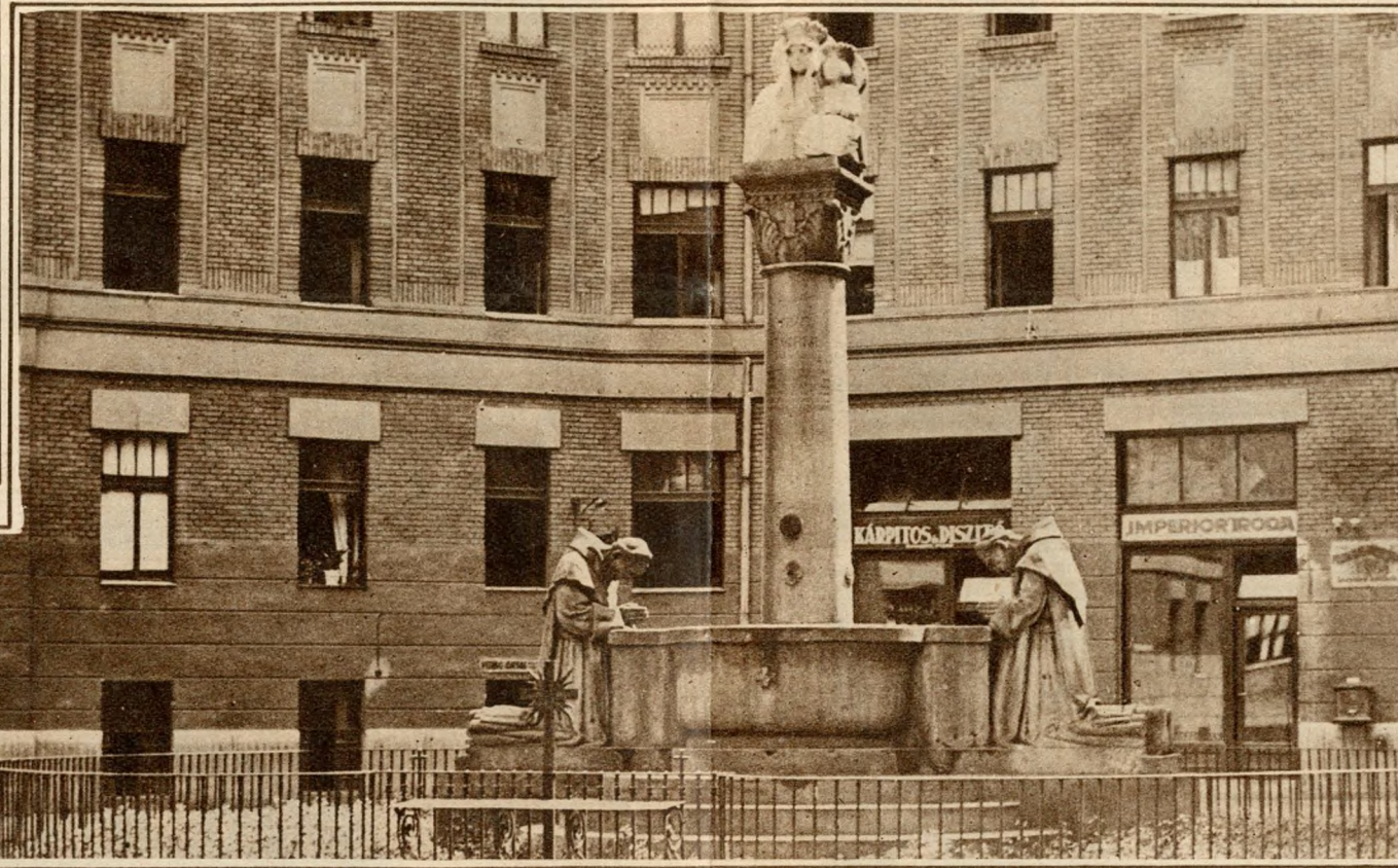
A papok kutja.