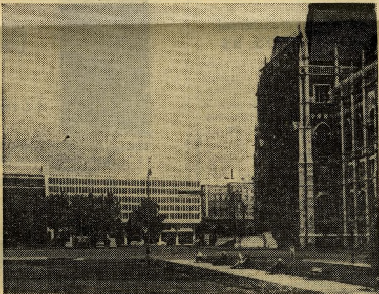
Háttérben: a Kossuth Lajos téri, sokat vitatott irodaház makettfotója.