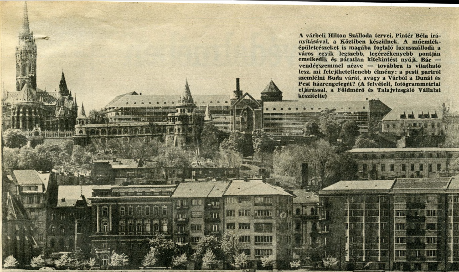
A várbeli Hilton Szálloda tervei, Pintér Béla irányításával, a Köztiben készülnek. A műemlék-épületrészeket is magába foglaló luxusszálloda a város egyik legszebb, legérzékenyebb pontján emelkedik és páratlan kitekintést nyújt. Bár — vendég szemmel nézve — továbbra is vitatható lesz, mi felejthetlenebb élmény: a pesti partról szemlélni Buda várát, avagy a Várból a Dunát és Pest házrengetegét?